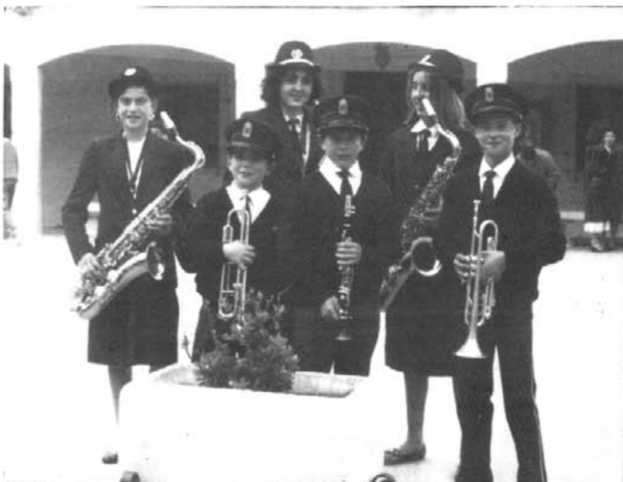
Fa cinc anys aquest grupet de nous músics juvenets sortiren amb la banda. Avui tres d'ells toquen amb la "Selecció Juvenil", com a músics joves aventatjats

totes les de Mallorca i farà un bon paper. Tan bo com qualsevol o més. Clar, sempre pot anar a millor, això depèn dels assaigs. Vull fer una observació: hi ha una banda dins Mallorca, de genteta jove, que destaca, com és la de l'Almudaina. Sobresurten per la seva joventut, el seu entusiasme, el nombrós grup que la componen i les seves interpretacions. I vull fer també una menció especial a la banda de Porreres.