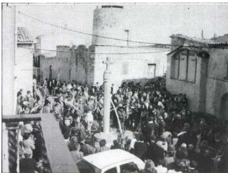
Enguany la benedicció de rams se celebrà a la Plaça de les Tres Creus. Hi hagué nombrosa participació, i en general va satisfer