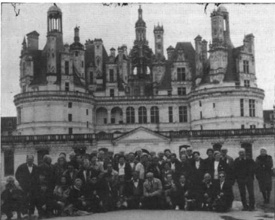
Durant tota la setmana que va del 19 al 26 d'abril passat, 35 montuïrers juntament amb altres persones de diversos llocs realitzaren una excursió a diferents llocs d'Europa, però sobretot a París, on varen visitar monuments i llocs d'interès històric i cultural. A la foto els veim tots reunits a la sortida d'un dels castells més importants d'Europa, concretament el de Chambord, situat a la vall del Loira