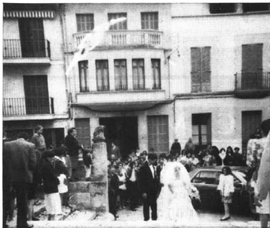
Les noces constitueixen generalment un espectacle. Són moltes les persones, sobretot dones, que es diverteixen de badocar sobretot el moment en que la novia entra o surt del cotxe davant els graons. L'espectacle posterior a vegades es converteix en una befa o una carnavalada, de