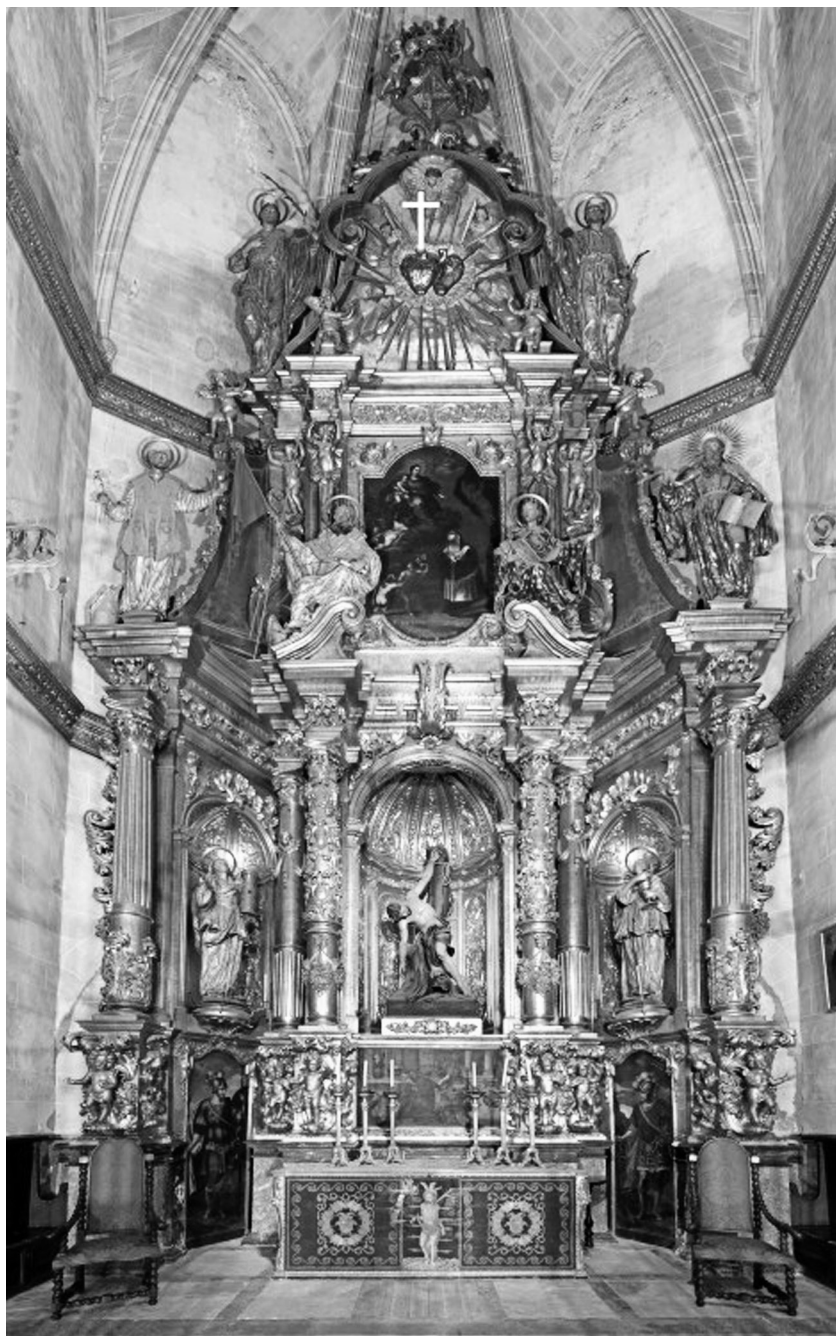
Fig. 1 Vista general del retablo de San Sebastián