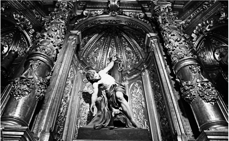
Fig. 7 Talla del santo titular, san Sebastián, situado en el centro del retablo