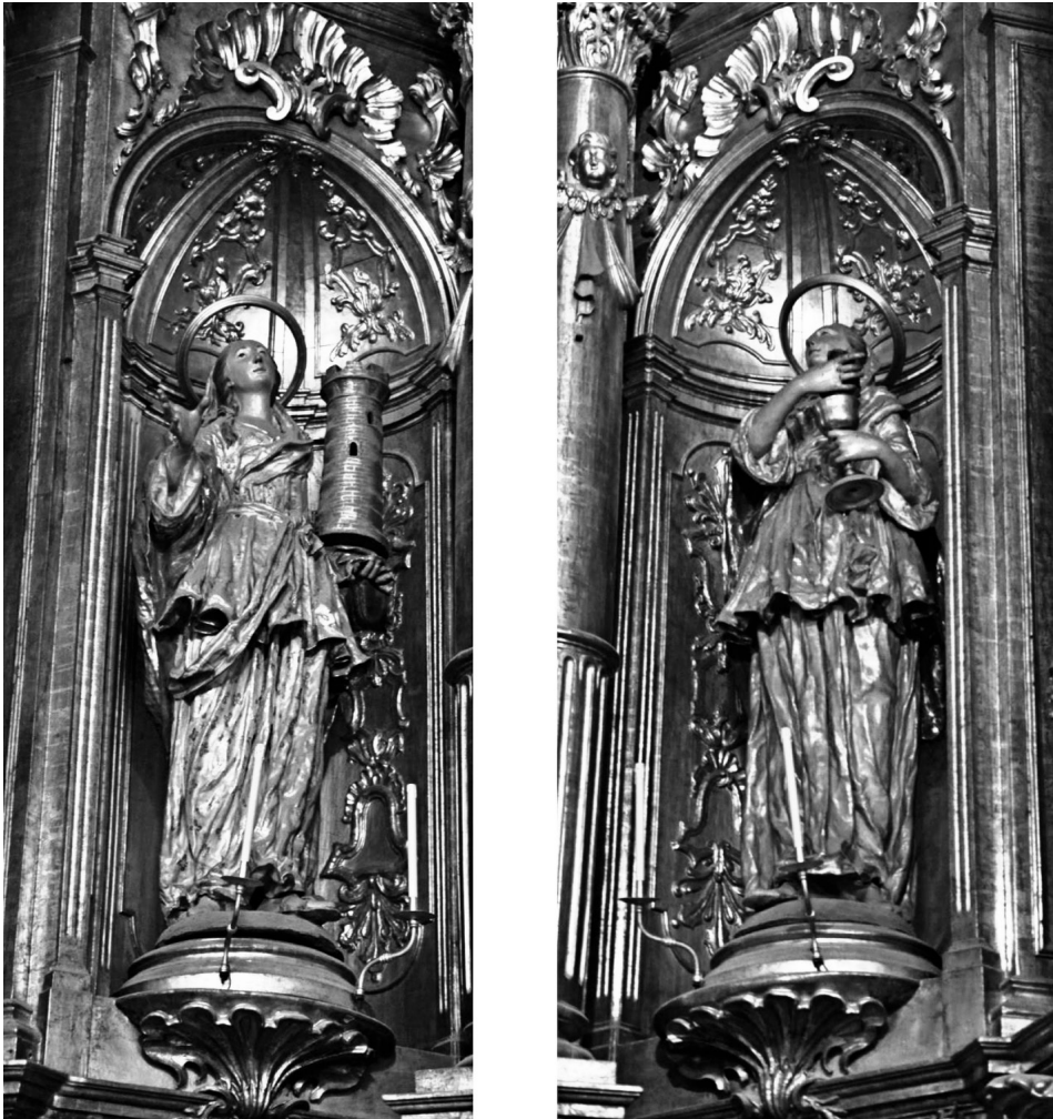
Fig. 6 Esculturas de las calles laterales del primer cuerpo del retablo: santa Bárbara y santa Práxedes