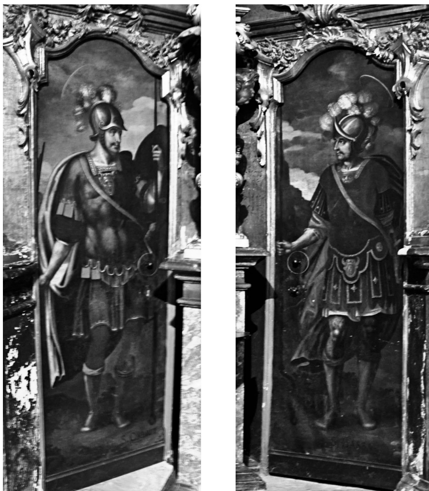
Fig. 5 Retratos de Cabrit y Bassa, en las puertas de acceso a la sacristía