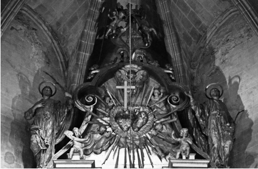
Fig. 8 Ático y coronamiento del retablo de San Sebastián