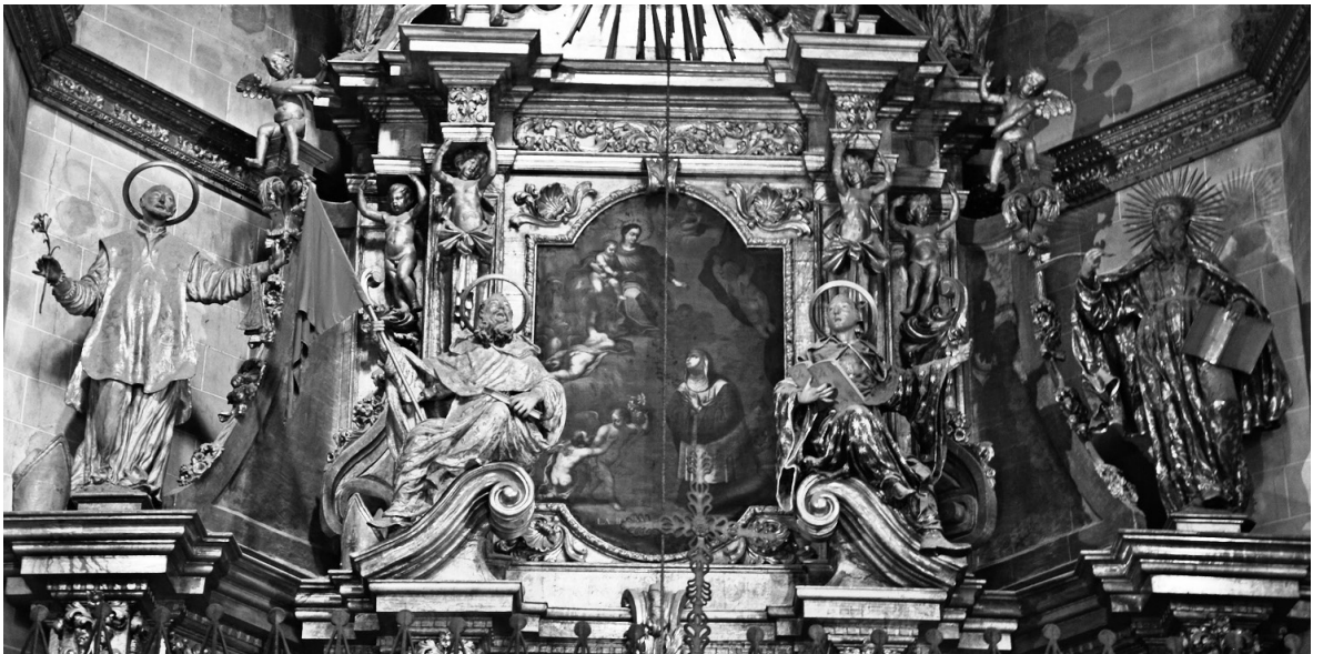
Fig. 9 Segundo cuerpo del retablo