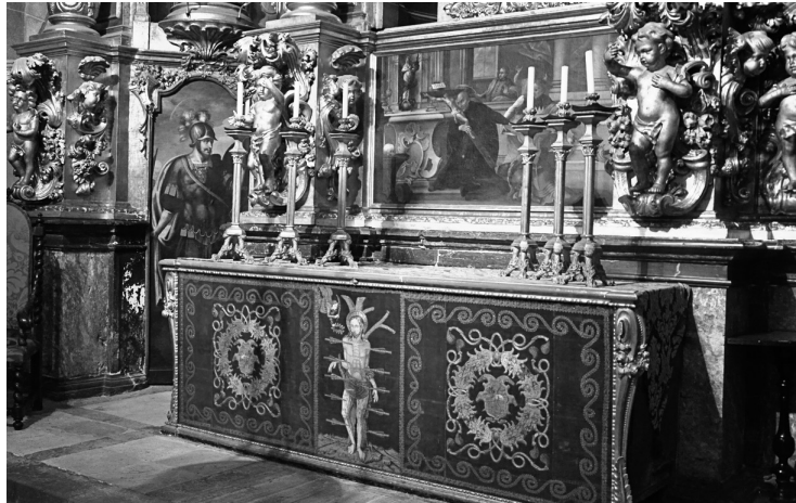
Fig. 3 Detalle de la parte inferior del retablo