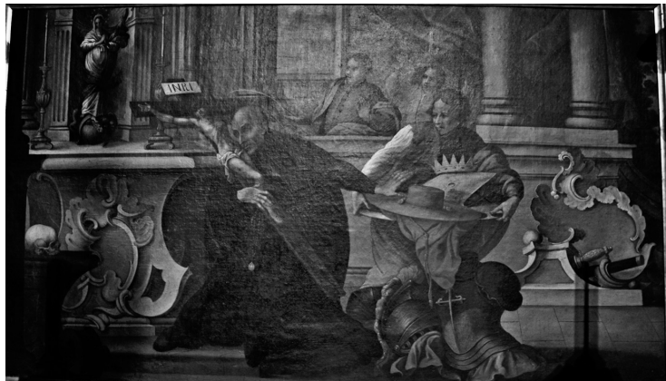
Fig. 4 Pintura central de la predela del retablo