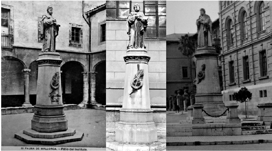
Fig. 6 Les tres ubicacions