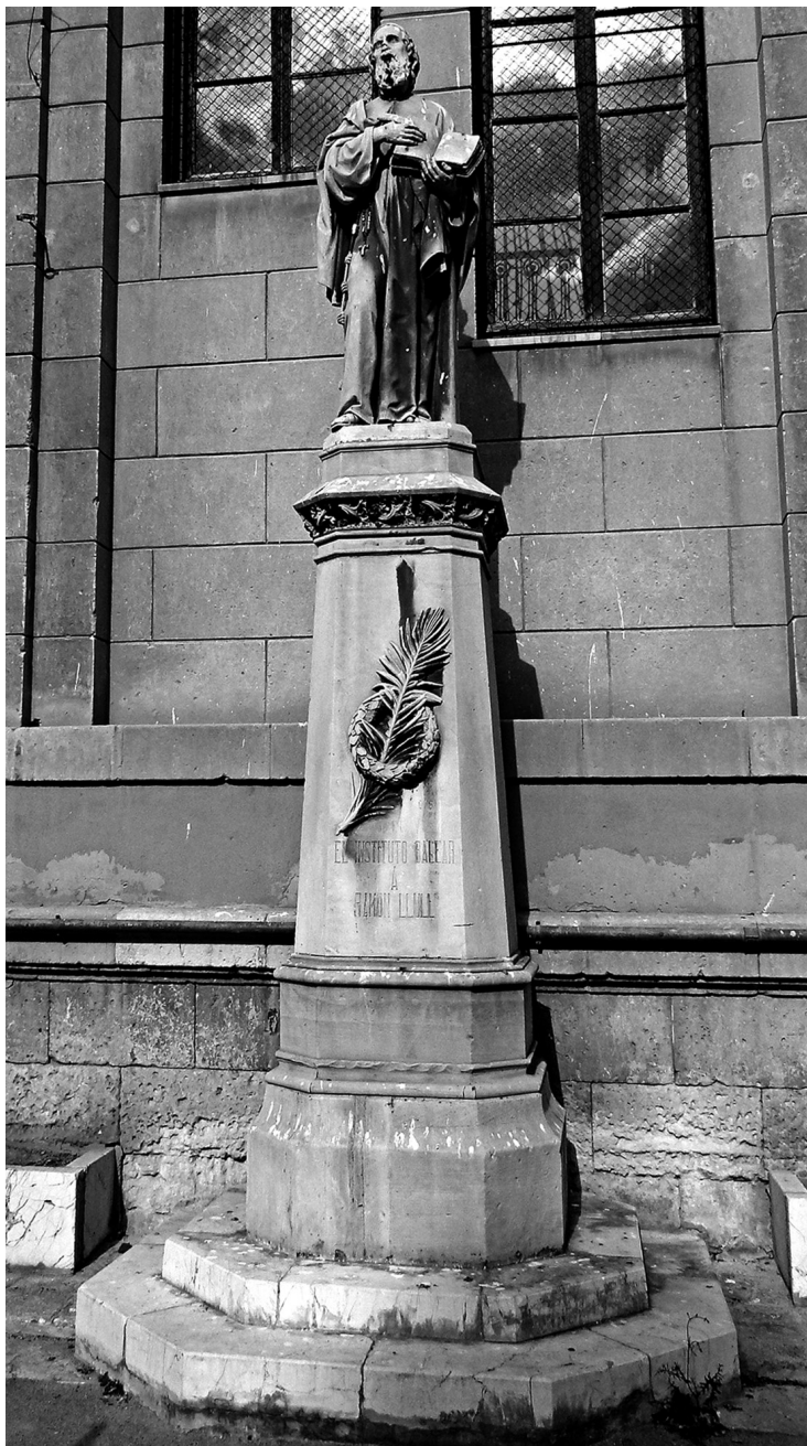
Fig. 5 Estat actual del monument (2016)