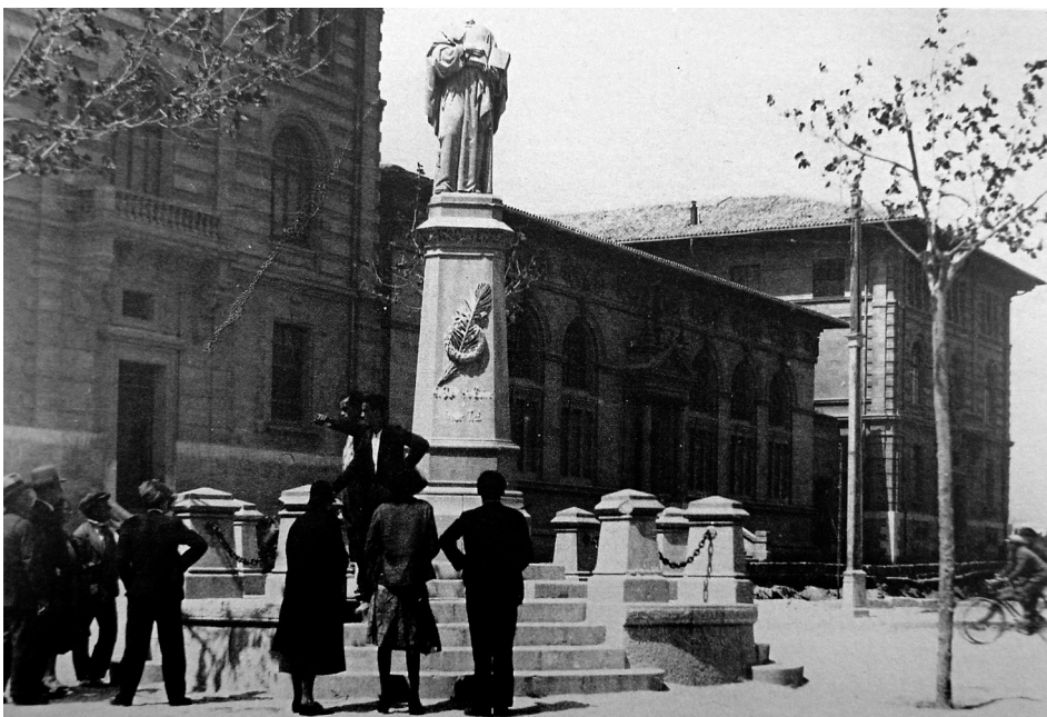
Fig. 2 Escultura de Ramon Llull decapitada. Nit del 14 al 15 d'abril del 1931