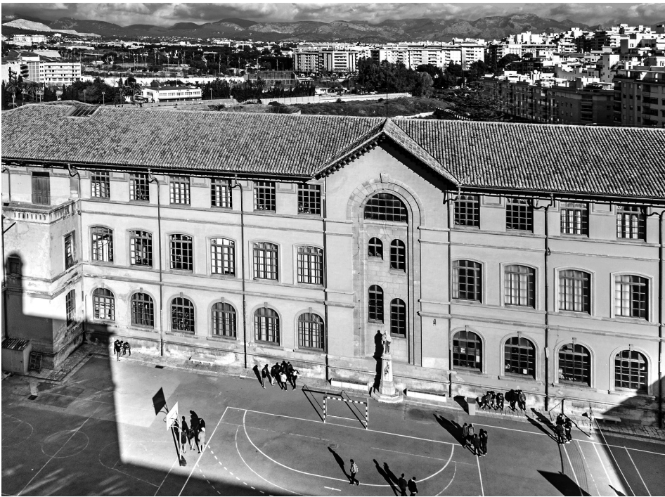
Fig. 9 Ubicació actual. Pati IES Ramon Llull (2016)