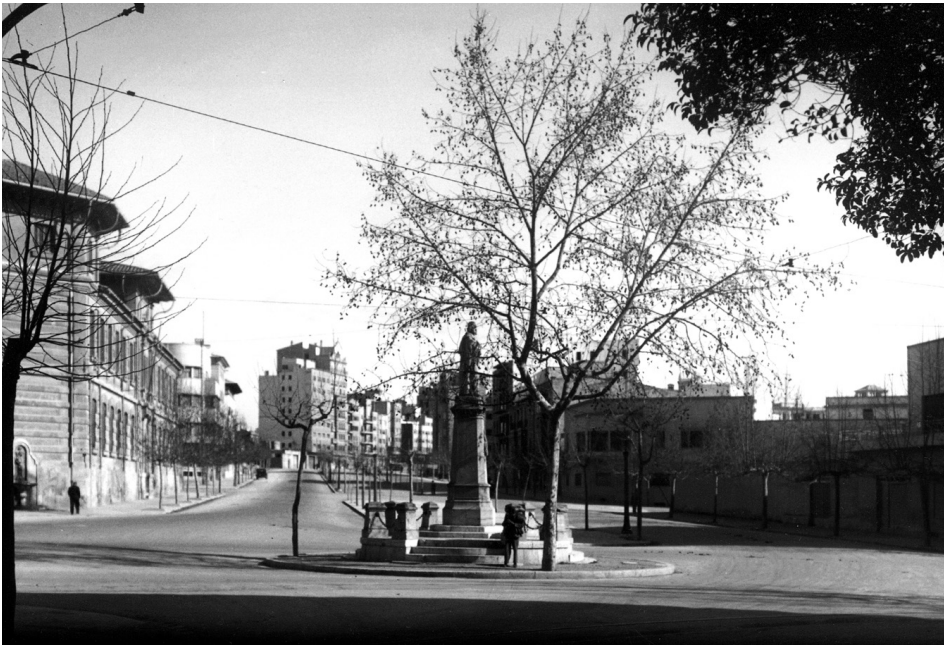
Fig. 4 Cruïlla avingudes-via Roma. Anys 60 del segle XX