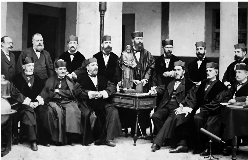
Fig. 1 Claustre de l'Institut Balear cap a 1889, a l'edifici de Montis-sion, presidint una escultura de Ramon Llull