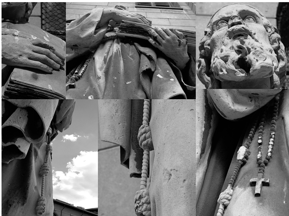
Fig. 8 Estat actual. Detalls Llull (2016)