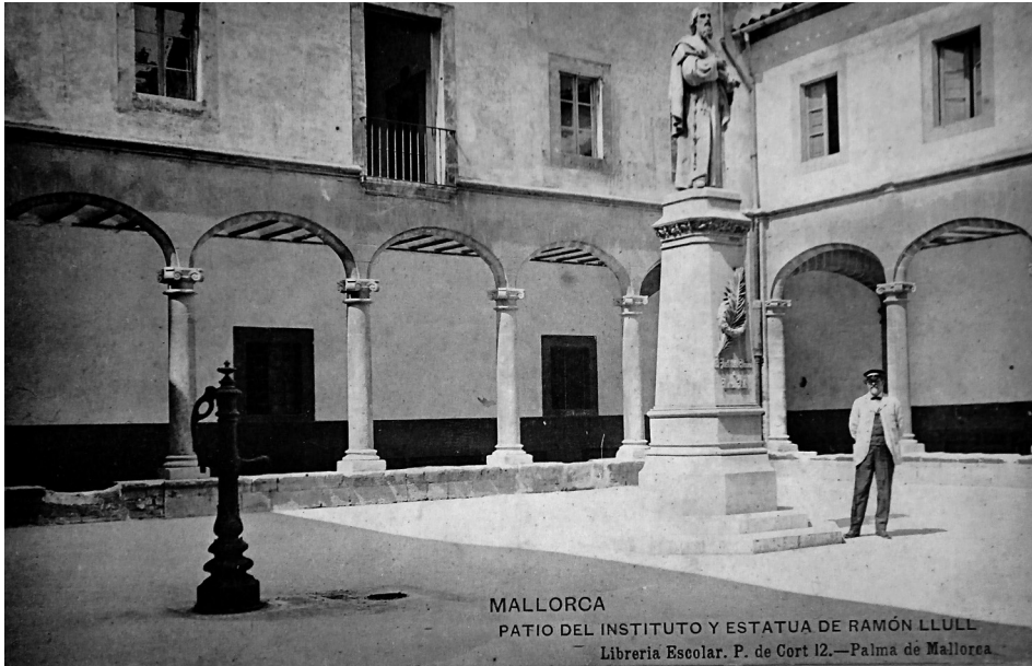
Fig. 3 Escultura de Llull al claustre de Montis-ion, seu de l'Institut Balear entre 1836 i 1916. Fixar-se amb les lletres en relleu a diferència de l'actual