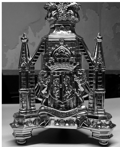
Fig. 1 Fig. 2

Fig. 1 i 2 Francesc Isaura Fargas. Creu de plata i detall de l'escut d'armes Cominges i Foix. 1878