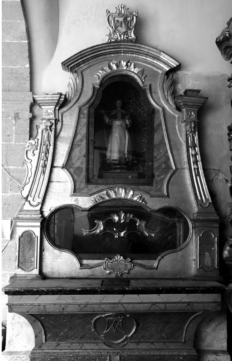
Fig. 6. Retaullet dels Alemany. Convent dels dominics. Pollença