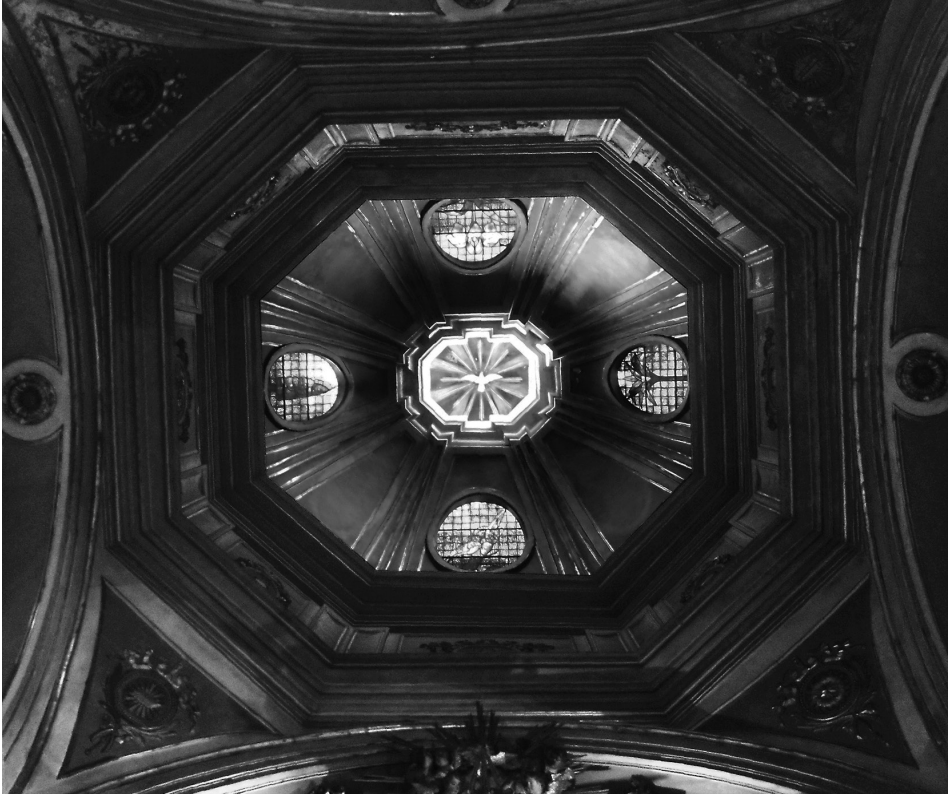
Fig. 7. Cúpula. Capella de la Puríssima (1804-1812). Convent de Sant Francesc. Palma