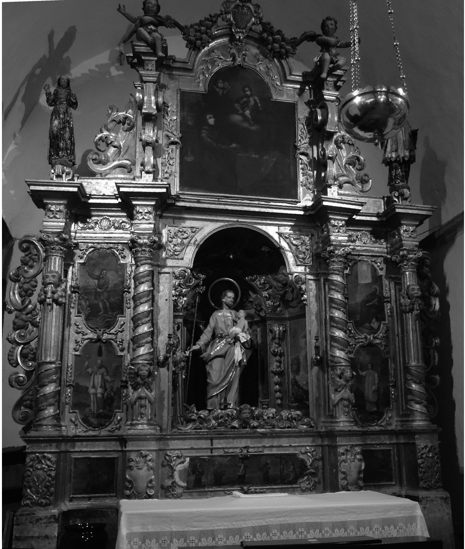
Fig. 1. Retaule de Sant Josep (ca.1727-1743). Deià