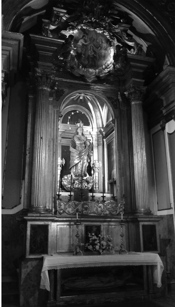
Fig. 8. Retaule de la Puríssima. Guillem Torres Rubert. Convent de Sant Francesc. Palma