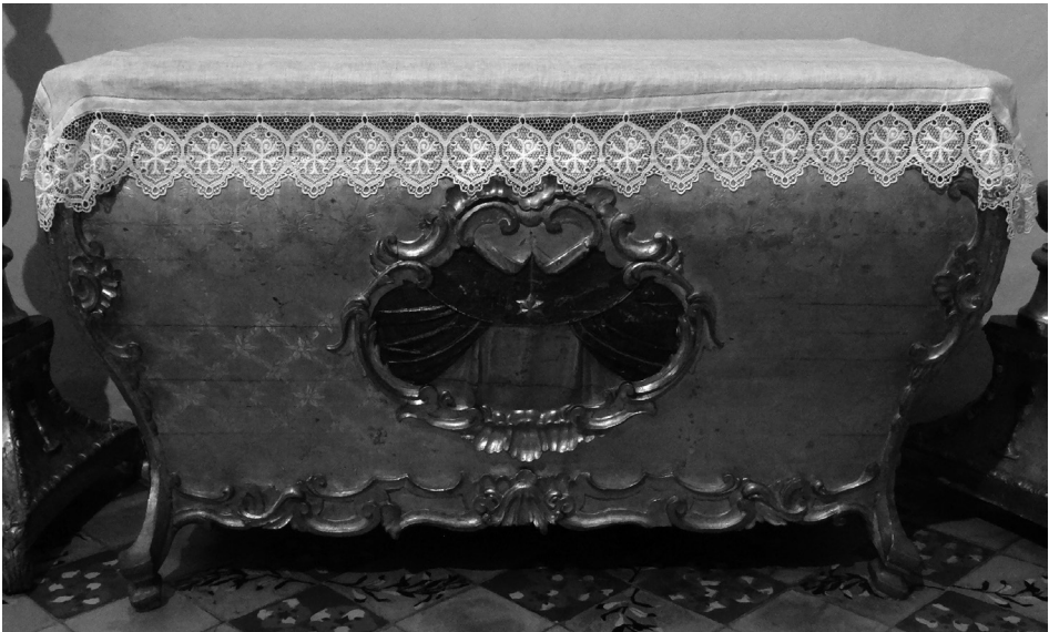
Fig. 3. Sarcòfag de la Mare de Déu Morta. Rafel Torres (ca. 1794). Pollença