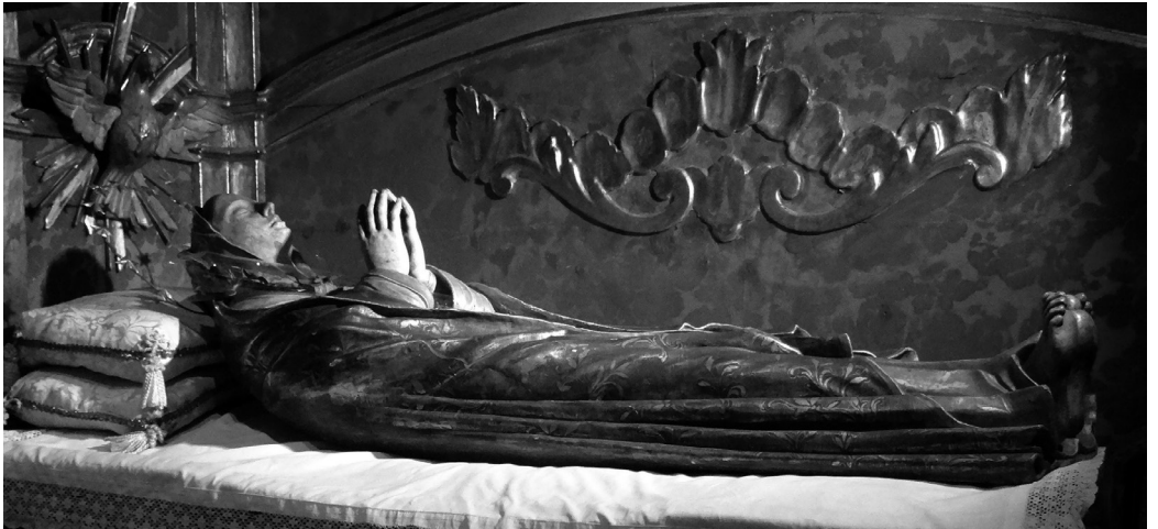
Fig. 4. Figura de la Mare de Déu Morta. Pollença