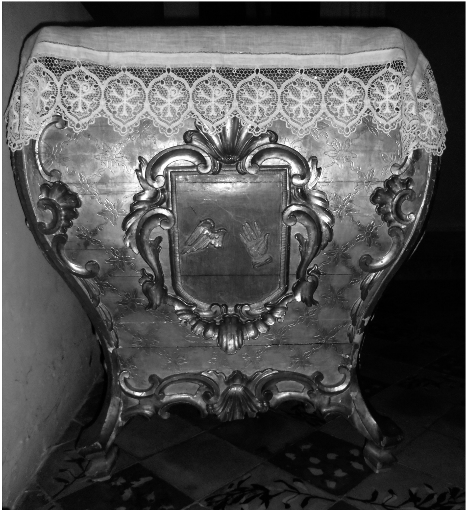
Fig. 5. Escut dels Alemany. Frontal del sarcòfag. Pollença