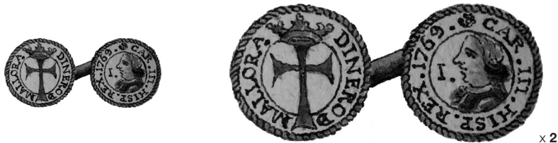
Fig. 3. Diner. Billó r/ DINERO DE MALLORCA. Creu llatina coronada dins una orla lineal. a/ CAR. III. HISP. REX. 1769. Flor de quatre pètals. Dins orla lineal, bust del rei mirant a l'esquerra i, davant la cara, número 1 i punt. ø = 13 mm Pes teòric: 0,8 g