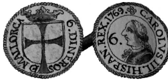
Fig. 2. Treseta (6 diners). Billó r/ 6 DINEROS DE MALLORCA. Creu llatina sobreposada a un escut coronat. a/ CAROLVS III HISPAN. REX. 1769. Flor de quatre pètals. Dins orla lineal, bust del rei mirant a l'esquerra i, davant la cara, número 6 i punt. ø = 20 mm Pes teòric: 4,79 g