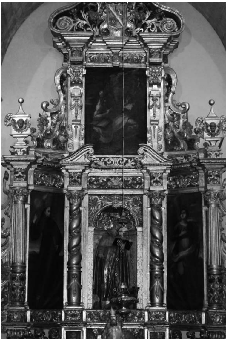
Fig. 8 Mateu Joan (traça i execució), 1709; pintor anònim, 1714: Retaule de sant Antoni abat. Església de Sant Nicolau, Palma