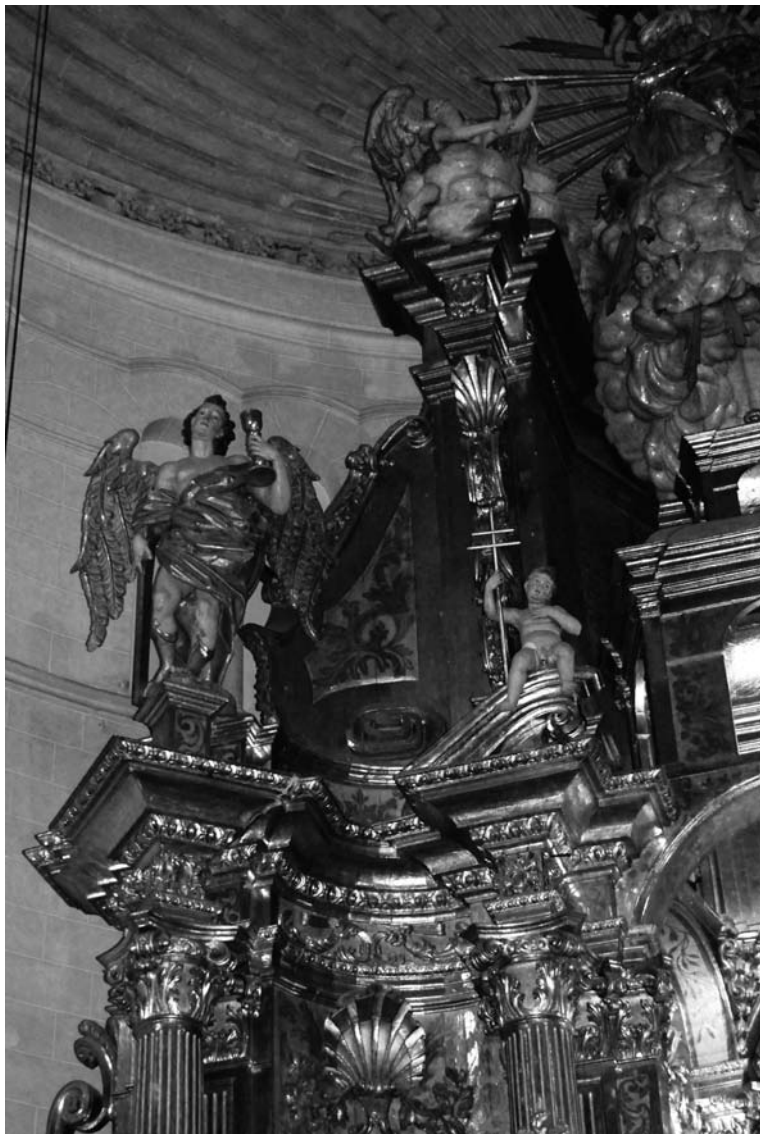
Fig. 3 Retaula major de l'església de Sant Nicolau, Palma (detall del coronament)