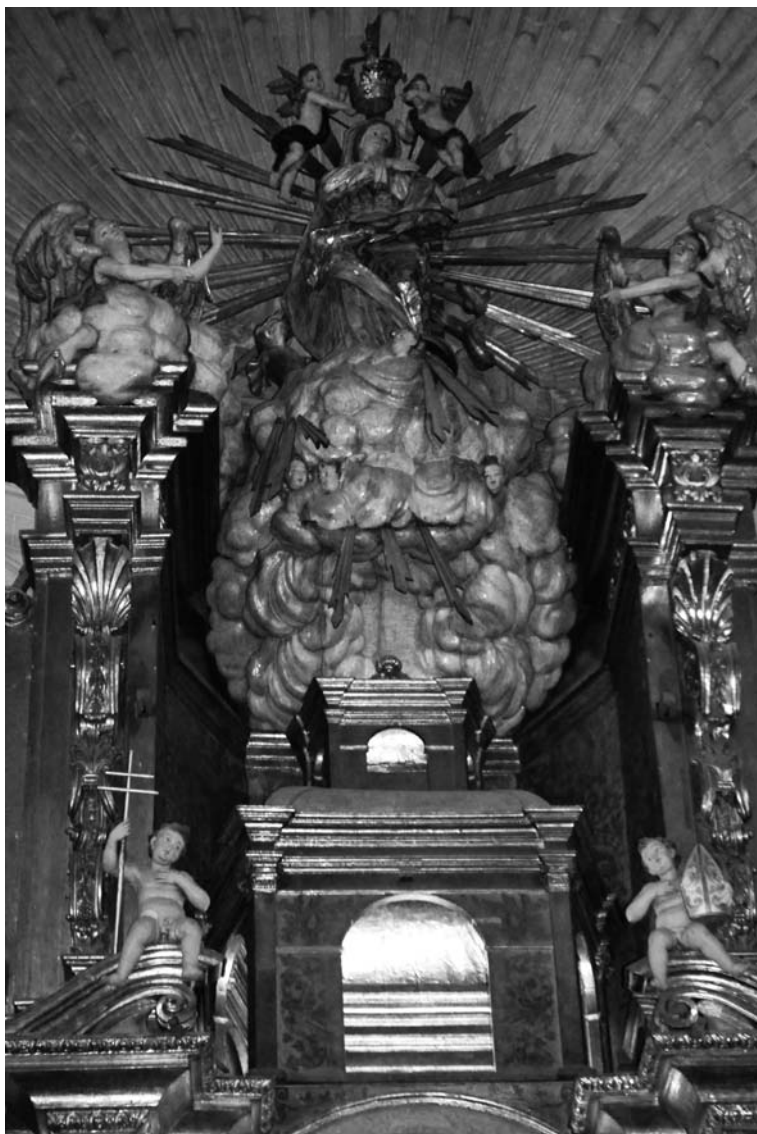
Fig. 2 Retaulle major de l'església de Sant Nicolau, Palma (detall del coronament)