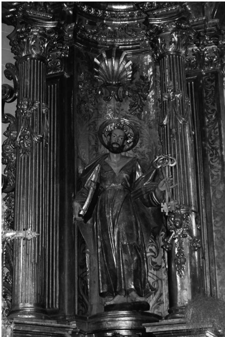
Fig. 6 Pere J. Obrador (atribució antiga), 1780: Sant Pere. Retaule major de l'església de Sant Nicolau, Palma