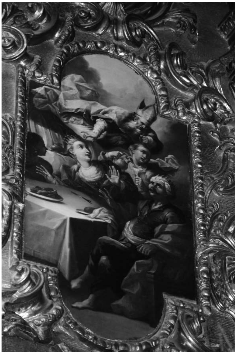
Fig. 4 Francesc Mesquida (atribució): Sant Nicolau rescata Deodat d'una família sarraïna. Retaule major de l'església de Sant Nicolau, Palma