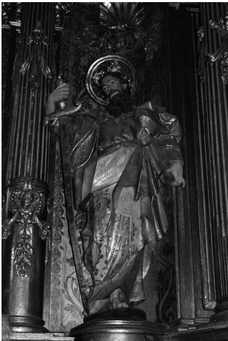
Fig. 7 Pere J. Obrador (atribució antiga), 1780: Sant Pau. Retaule major de l'església de Sant Nicolau, Palma