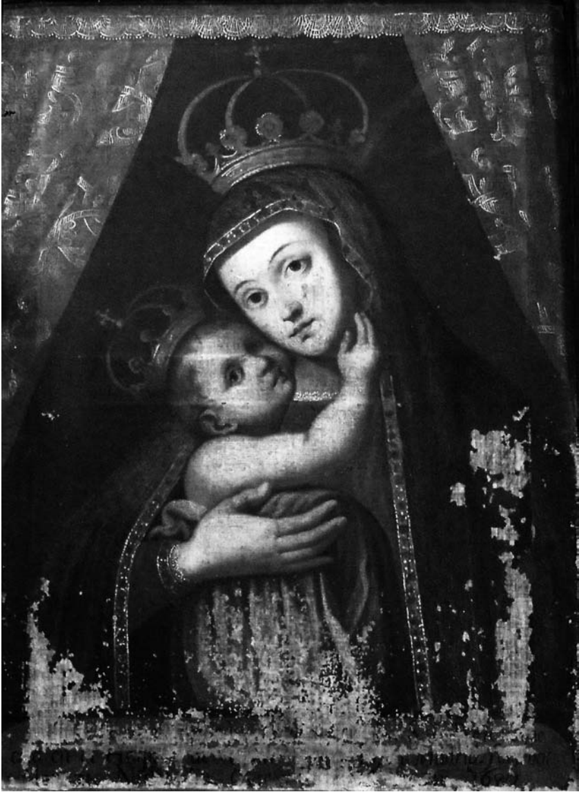
Fig. 3 Nostra senyora de Betlem