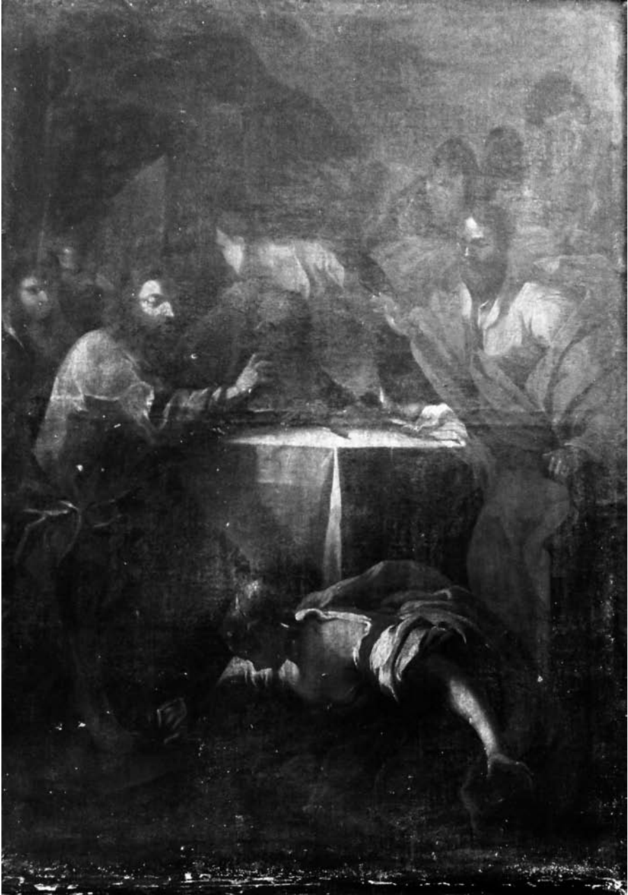
Fig. 1 Crist a la casa del fariseu