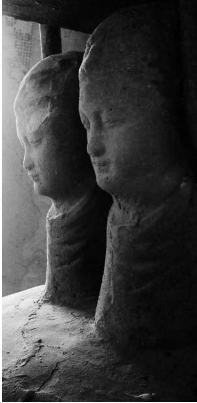
Fig. 5 Detall antropomòrfic de la campana