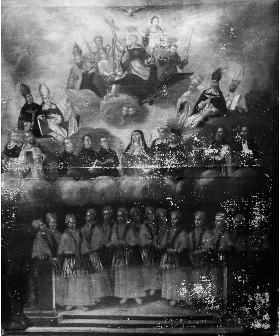
Fig. 2 Triomf de sant Tomàs d'Aquino