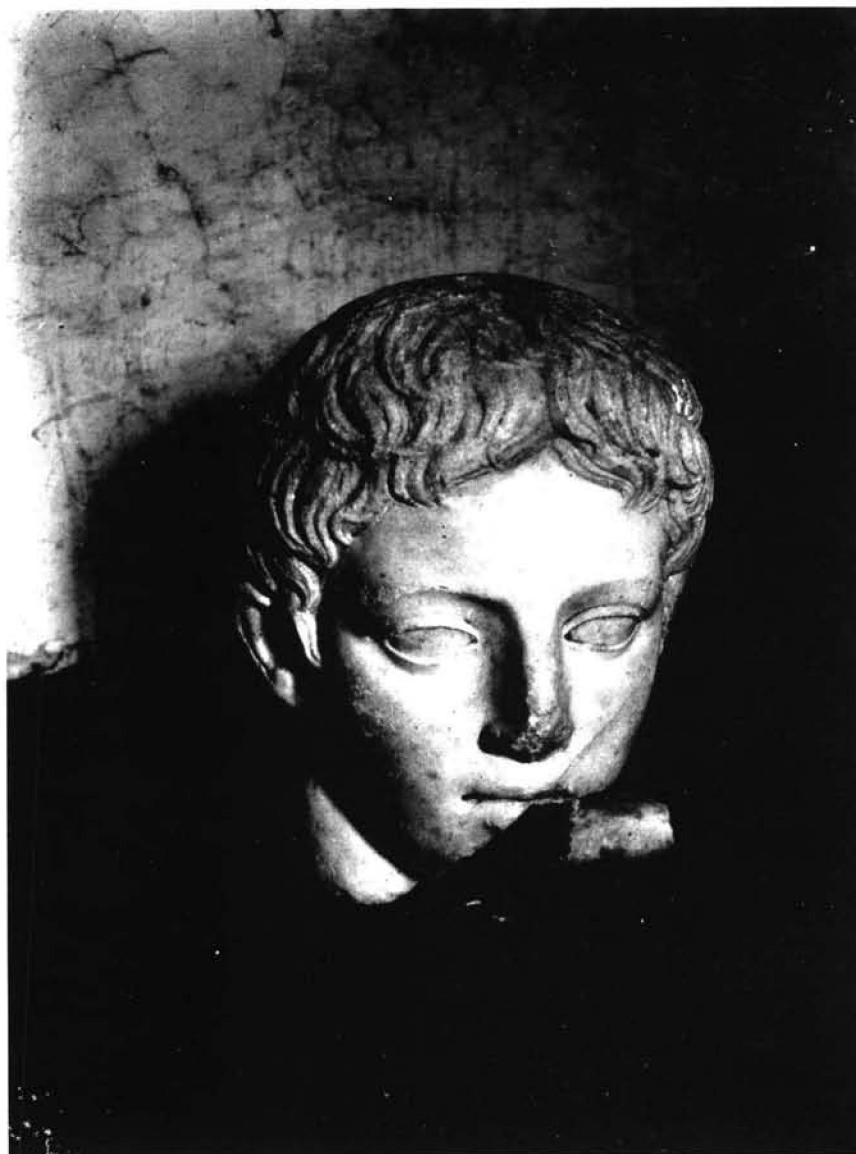
FIG. 4: Cap d'escultura masculina. Fotografia n° 724 de la Colecció Fotografica de Jorge Bonsor