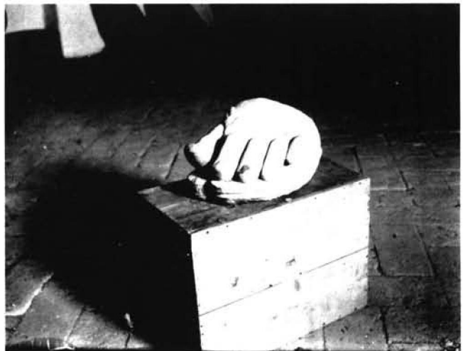
Fig. 6: Fragment d'escultura de peu. Sota el dit gros pot apreciar-se la lletra "A" que deu correspondre a una de les de la paraula "BALIAR".