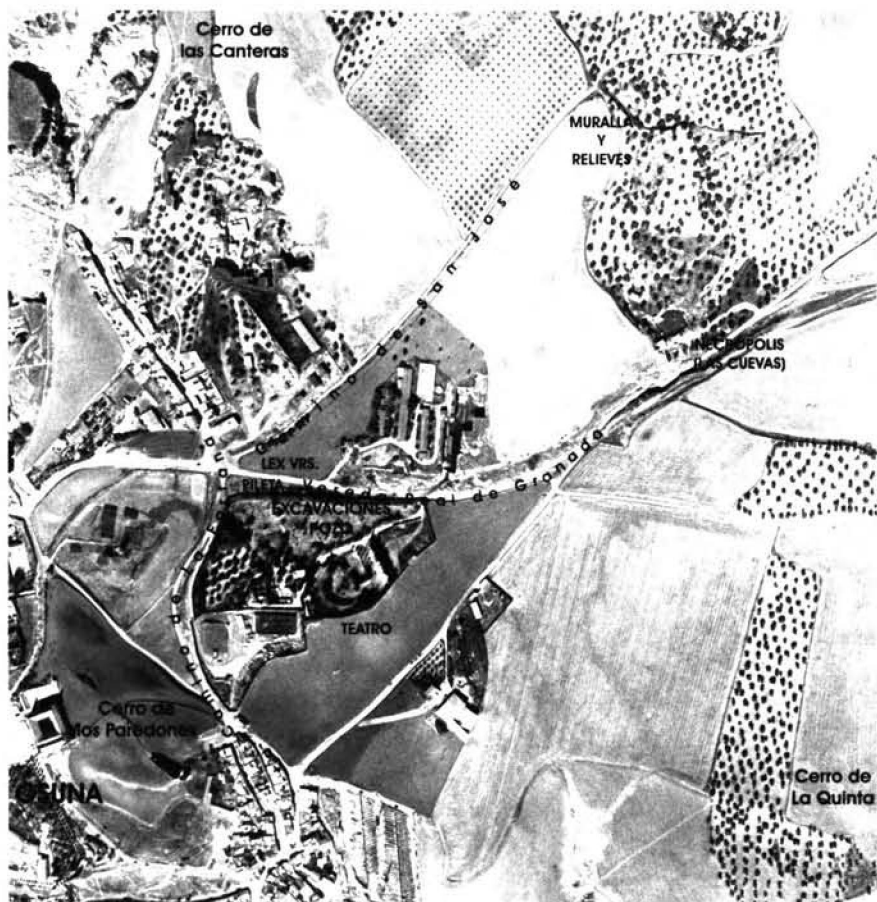
FIG. 1: Fotografia aèria d'una part del jaciment amb indicació d'alguns dels elements citats en el text (s'ha emprat com a base el fotograma nº 8743 del vol realitzat a l'octubre de 1993 per encàrrec de l'ajuntament d'Osuna).