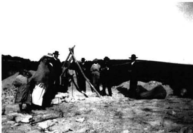
FIG. 3: Fotografia procedent de l'àlbum de P. Paris d'Osuna conservat a la Casa de Velázquez. Conté una llegenda que diu "al lado de las excavaciones"; això ens fa pensar, junt amb la topografia, que es tracta de l'excavació del pou on apareguren les peces escultòriques.