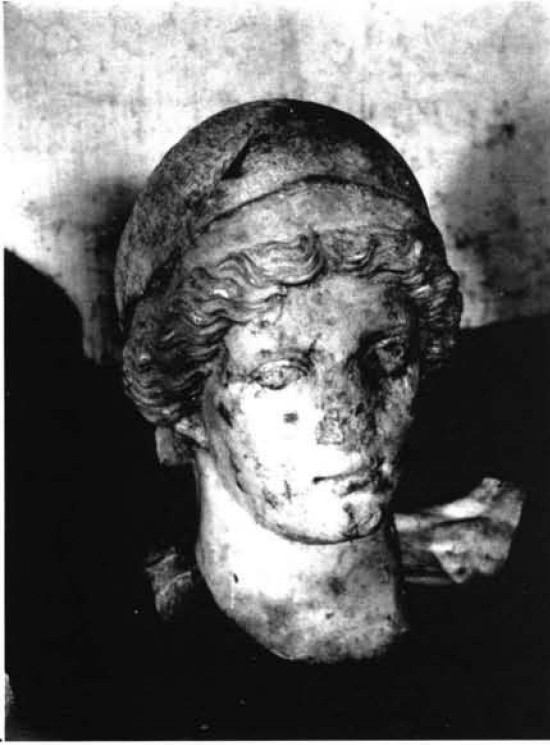
FIG. 5: Cap d'escultura femenina. Fotografia n° 723 de la Colecció Fotogràfica de Jorge Bonsor .