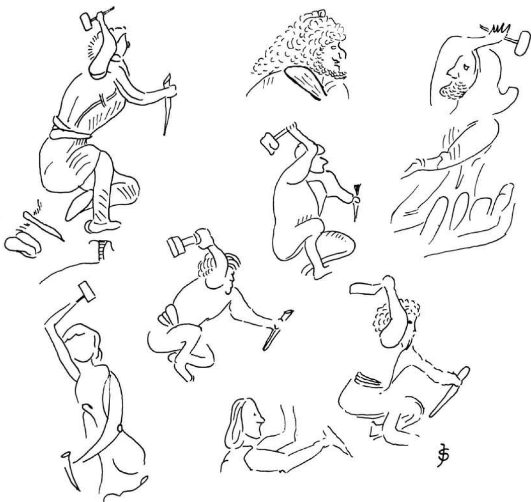
Picapedreros de la Seo según el libro de fábrica de 1390