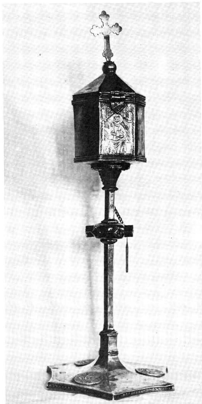
Fig. 1.— Portaviáticos de plata conservado en la parroquia de Algaida. Siglo. XV.