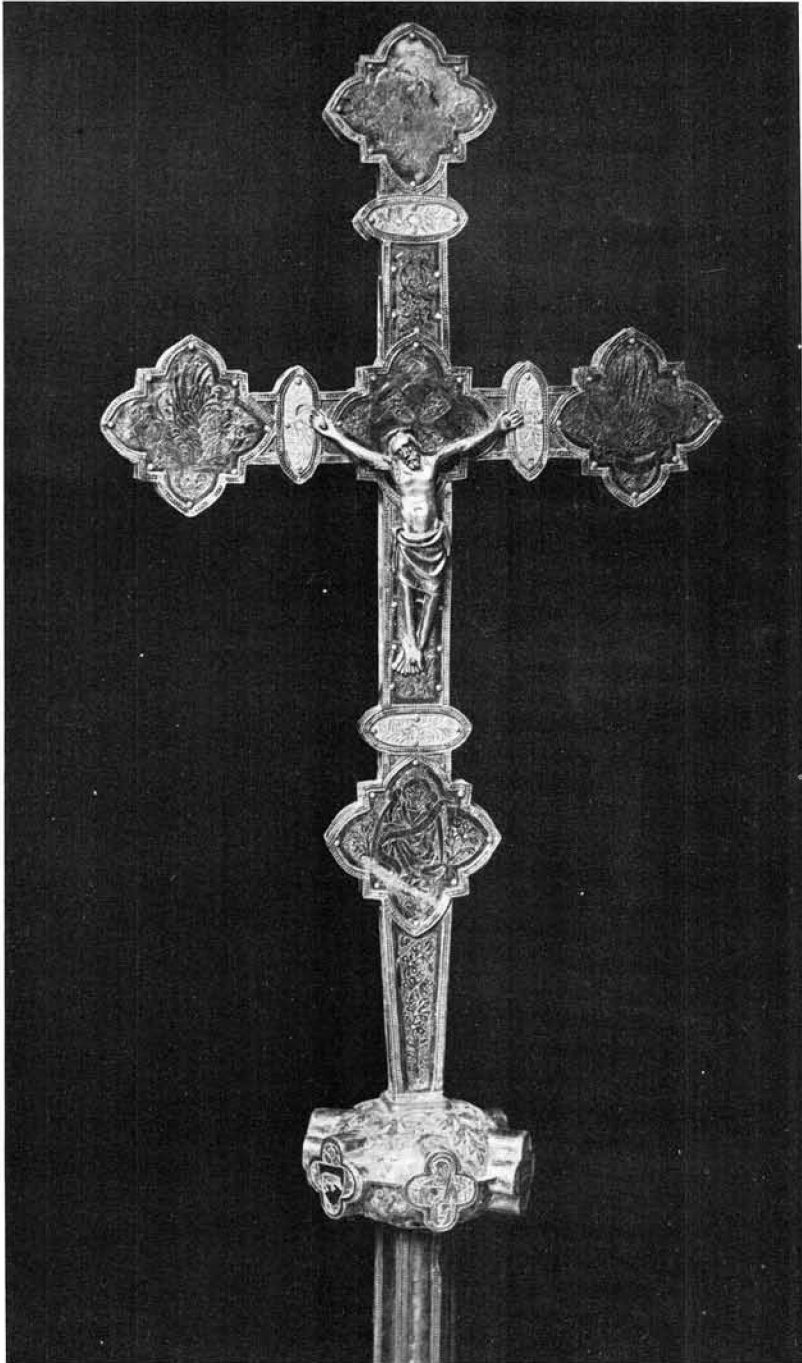
Fig. 4.— Cruz de plata de la parroquia de Valldemossa. Siglo XV.