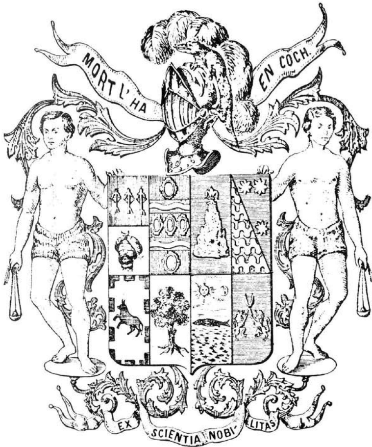
Escudo: Blasón familiar Rosselló-Miralles ordenado por J. M. Bover. Adviértase la presencia del "Drac de Na Coca" encima de la cimera, junto con la divisa alusiva: Mort l'ha en Coch. (Grabado extraído del folleto aludido en el texto).