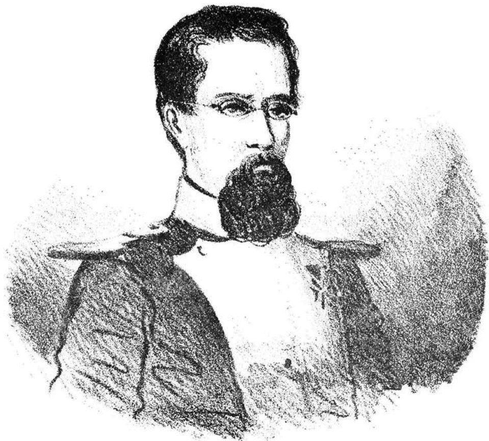
Litografia d'un dibuix a llapis anònim publicat per "El Trono y la Nobleza".