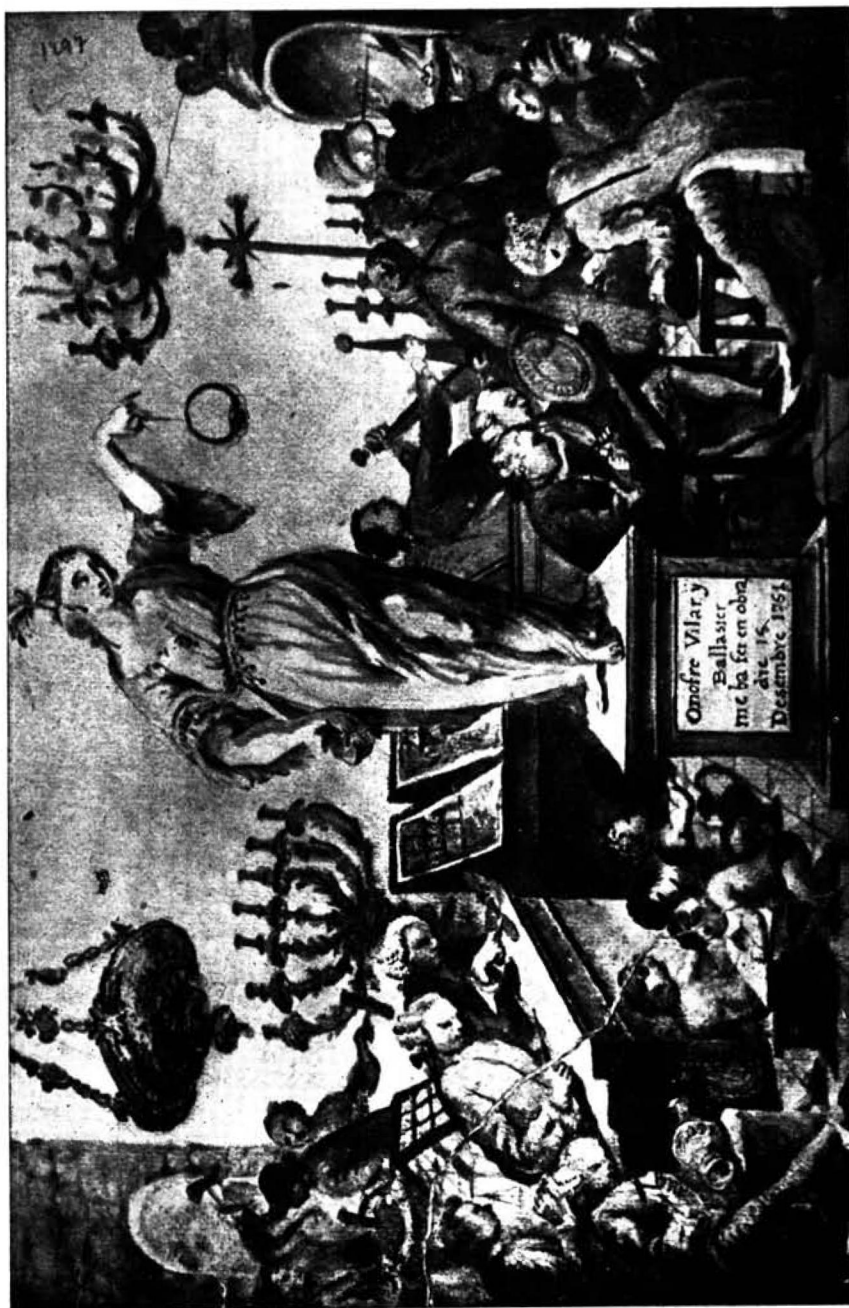
Interior de un taller de orfebreria barcelonés. 1751.