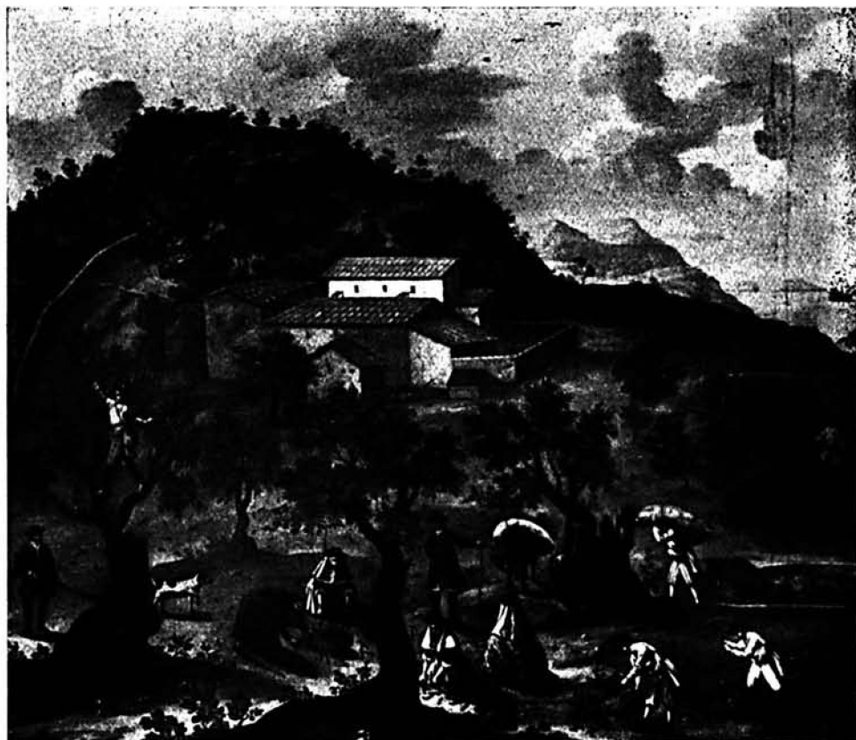
RECOLECCIÓN DE LA ALGARROBA