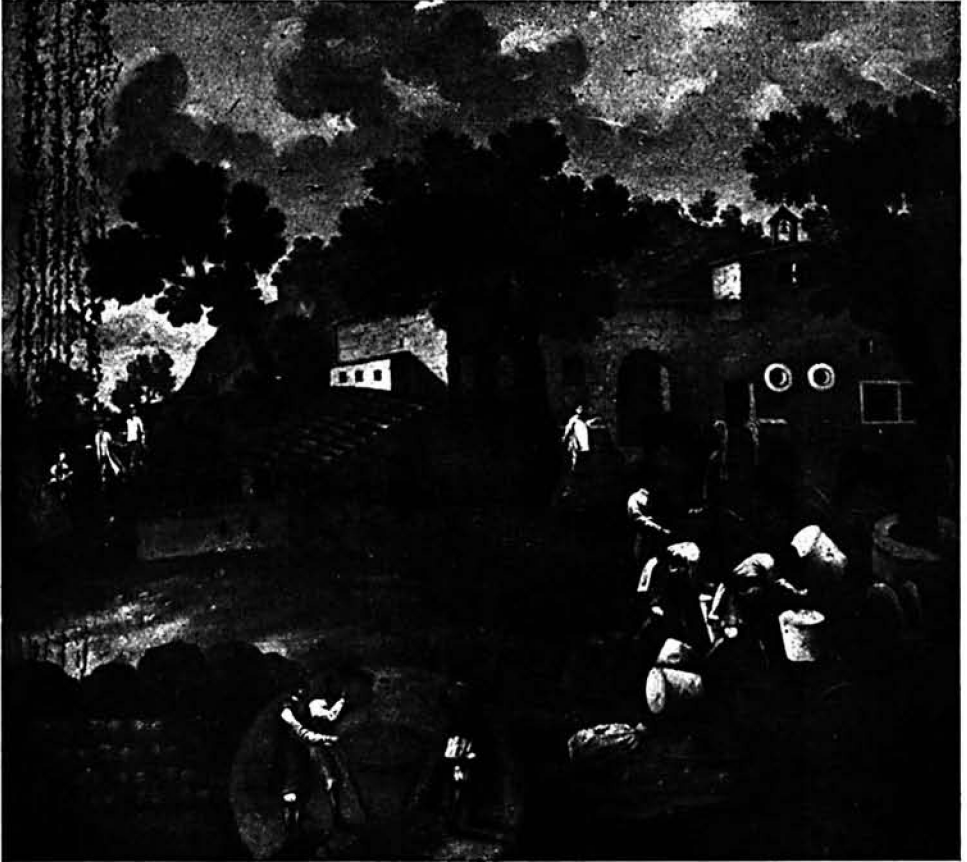
LABORES DE TRILLA