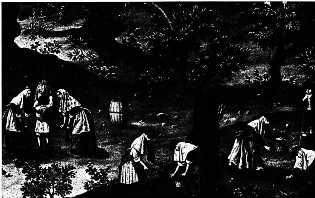
DETAI.LE DE LA LAM. CXC.VII