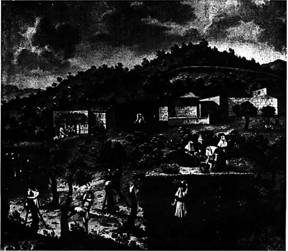
INJERTO DE OLIVOS Y ESQUILA DE LAS OVEJAS