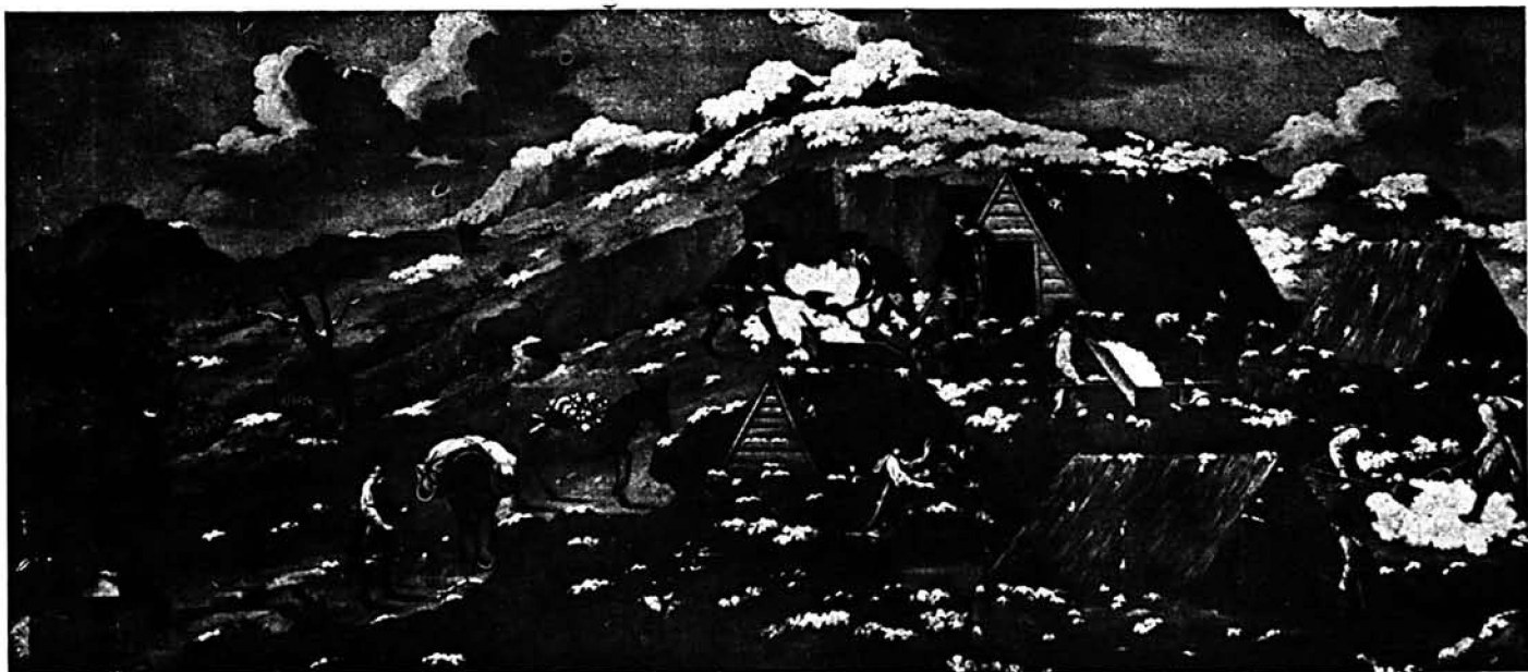
RECOGIDA DE LA NIEVE