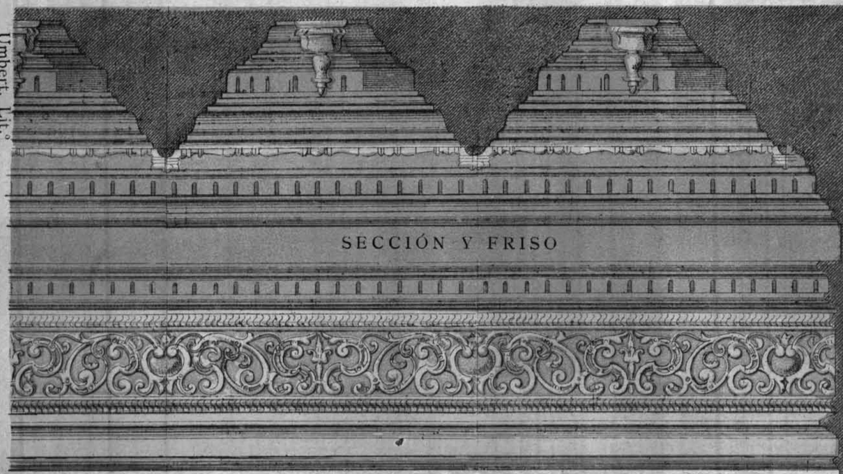
SECCIÓN Y FRISO