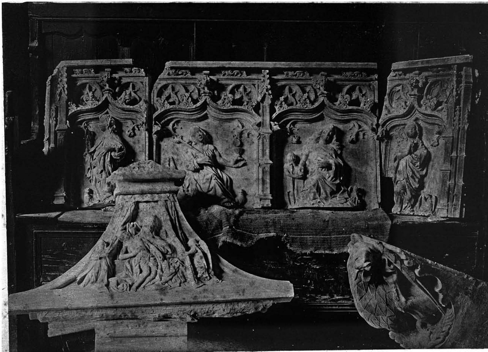
SEPULCRO DEL MAESTRO PEDRO JUAN LLOBET, EN LA CATEDRAL.—[ Siglo XV. ]