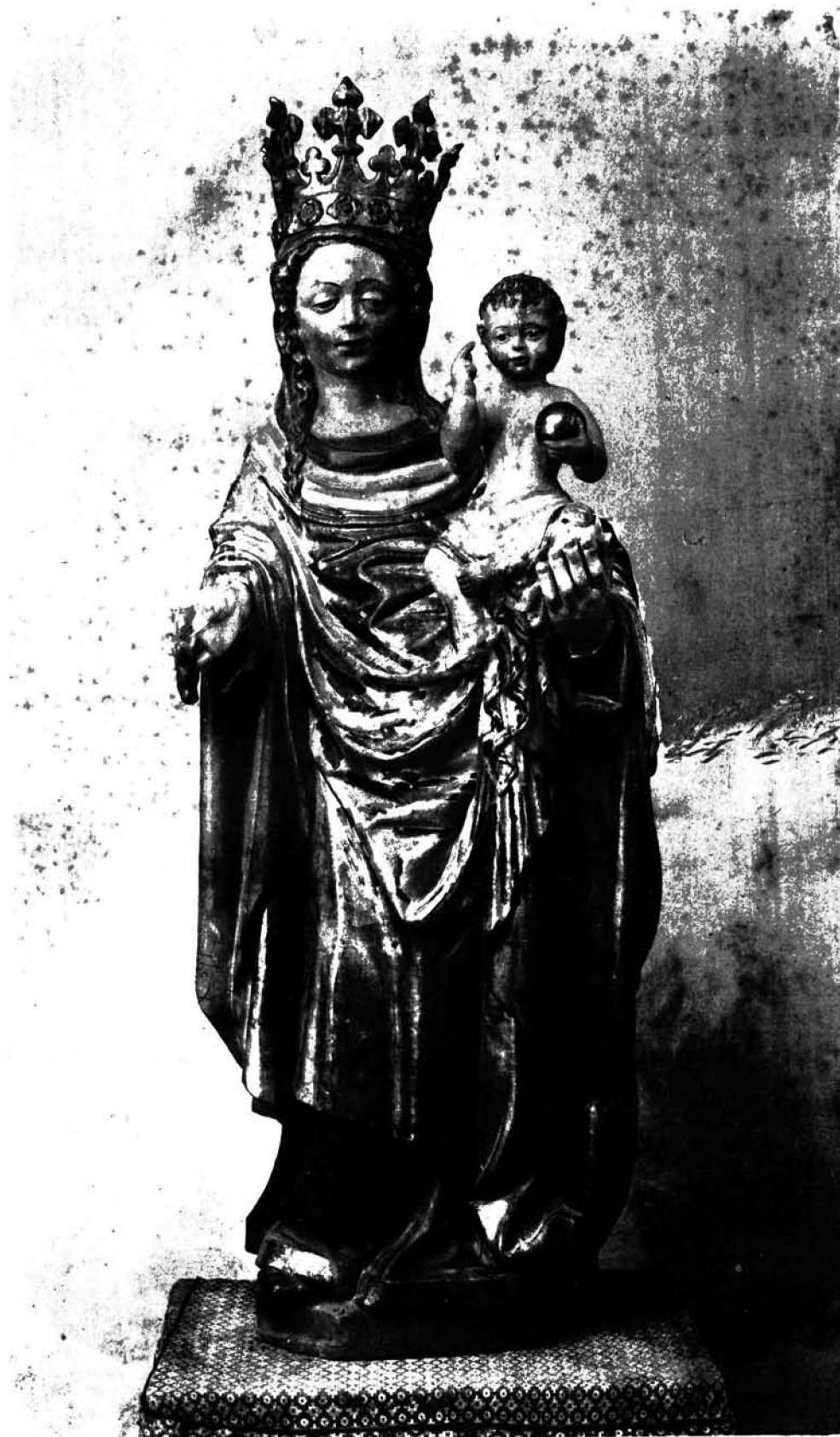
ICONOGRAFÍA DE LA VIRGEN — EN MALLORCA.