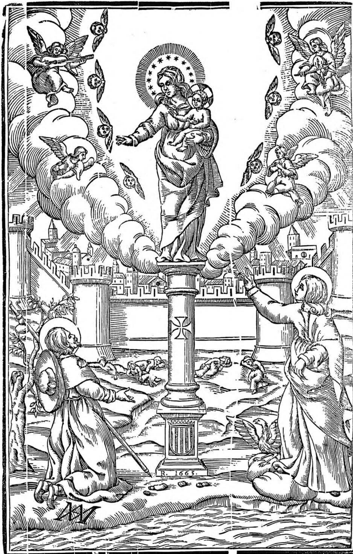
MARE DE DEU DEL PILAR DE ÇARAGOSSA