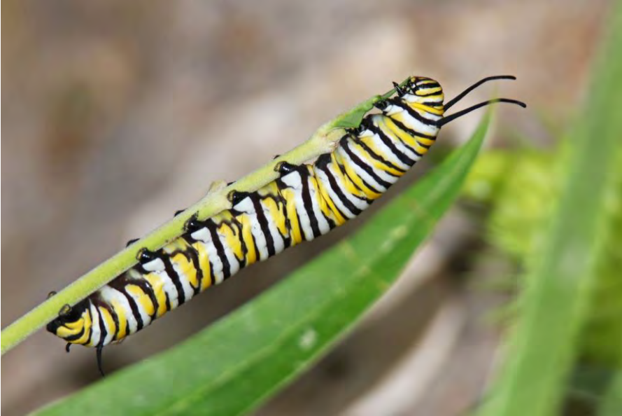
Fig. 2. Eruga localitzada a la finca pública de Mortitx el setembre de 2022, a una població de Gomphocarpus fruticosus .

Fig. 2. Larva found at the public estate of Mortitx in September 2022, in a population of Gomphocarpus fruticosus .