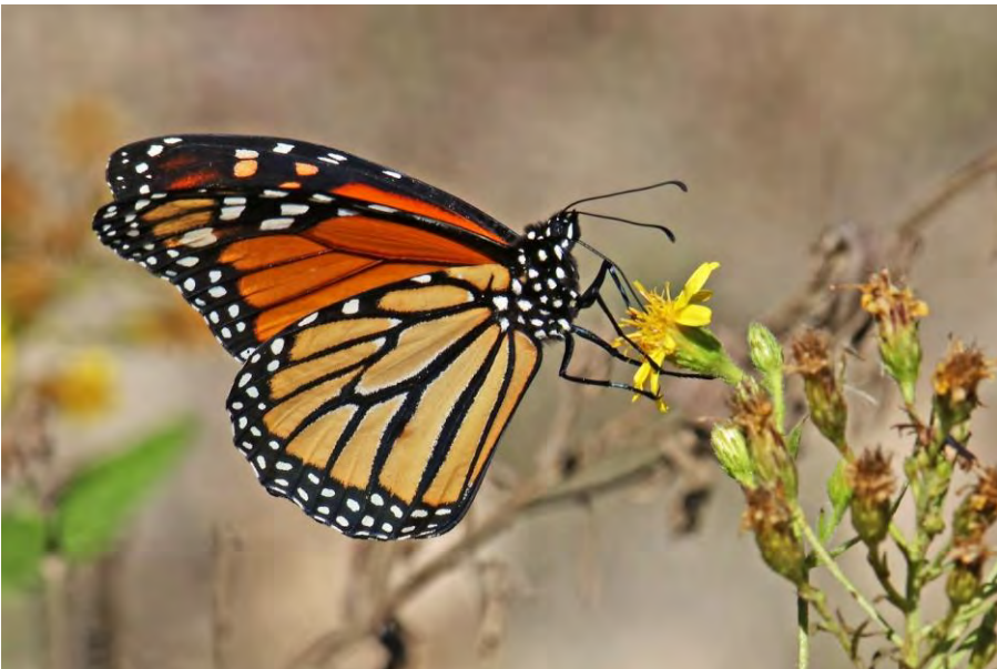
Fig. 3. Adult fotografiat a la localitat de cria del torrent de Sant Miquel el novembre de 2022.

Fig. 2. Larva found at the public estate of Mortitx in September 2022, in a population of Gomphocarpus fruticosus .