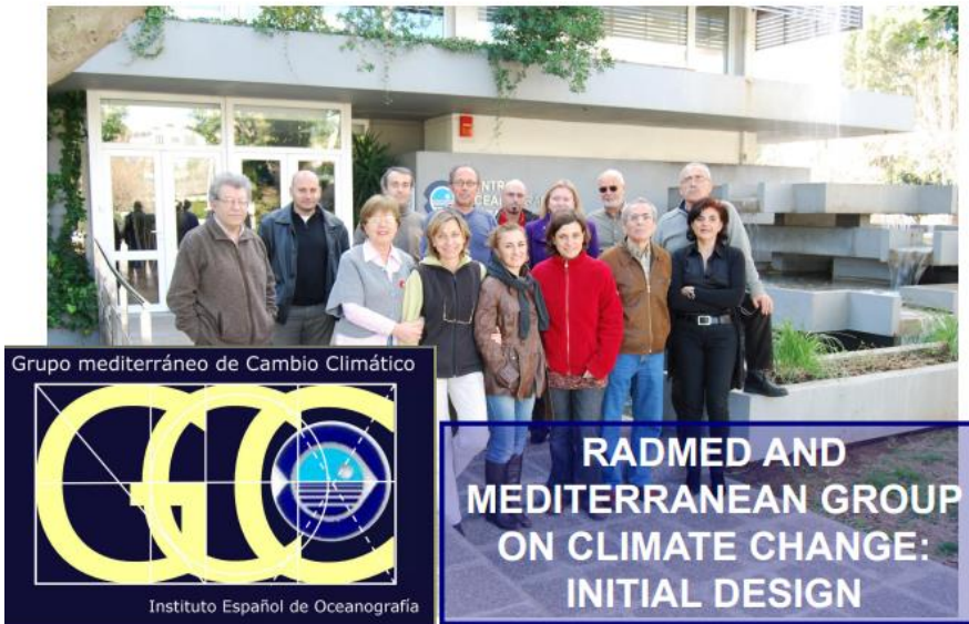
Fig. 6. Imatge a les portes del COB, dels companys del Grup de treball mediterrani de canvi climàtic

El 2010, se recorda a Rapp. Comm. Int. Mer Médit. (Amengual et al. , 2010) que la gestió del medi marí requereix sistemes d'observació multidisciplinaris i multitasques per avaluar les interaccions costaneres/mar obert i les interaccions entre diferents conques. Això només es pot aconseguir mitjançant la cooperació internacional dels programes nacionals de seguiment. Entre els programes de l'IEO al Mediterrani de les costes espanyoles hi ha el RADMED (Amengual et al. , 2010; López-Jurado 2015a, 2015b).