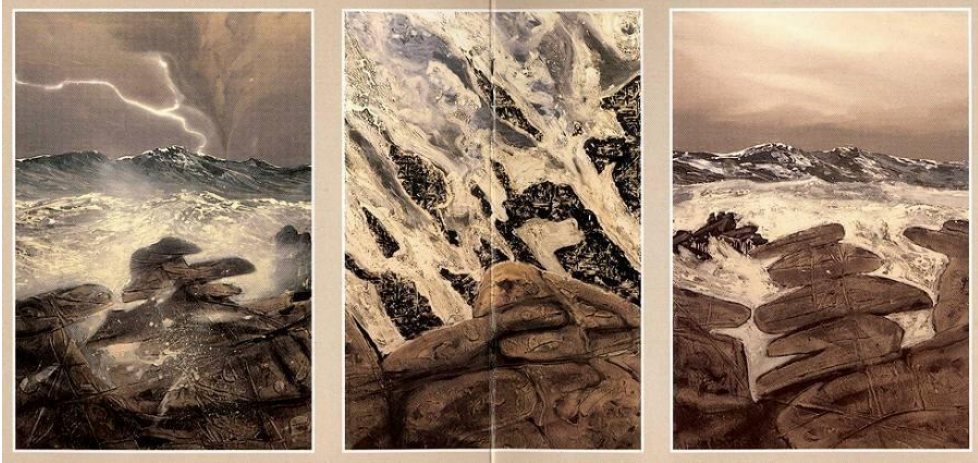
Fig. 5. Tríptic de sa Tramuntana es va inspirar en els espectaculars paisatges marins costaners que es poden observar freqüentment a l'illa de Menorca durant alguns esdeveniments meteorològics associats al vent de tramuntana. Acrílic i oli sobre tela, tres quadres, 130 x 89 cm cadascun. Cedit per l'Institut Español de Oceanografía a l' International Council for the Exploration of the Sea (ICES) a Copenhaguen a Dinamarca.

El 2007 presenta un article, en col·laboració, a la revista Progress in Oceanography , on es presenten estudis de sèries temporals de plàncton de les aigües de les Illes Balears durant l'última dècada, amb èmfasi principal en la variabilitat del zooplàncton i la seva relació amb el medi ambient. Els patrons estacionals i interanuals de temperatura, salinitat,