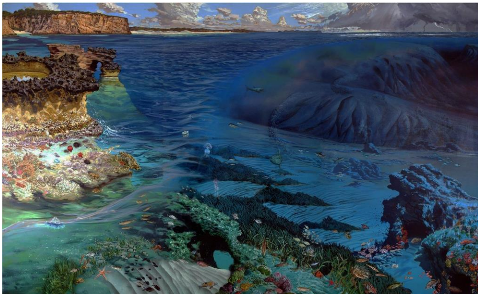
Fig. 3. De la seva passió per la pintura trobam aquest tríptic pintat per Xavier Jansà que mostra els fons marins de Balears i que decora les instal·lacions del Centre Oceanogràfic de Balears de l'IEO.

Balears i, així, participa en quatre comunicacions a les IV Jornades (Fernández de Puellas et al. , 2004; Aparicio et al. , 2004; Alemany et al. , 2004; Jansà et al. , 2004 i a dues a les VI Jornades (Aparicio et al. , 2013; Deudero et al. , 2013), ambdues organitzades per la SHNB. La temàtica presentada a les Jornades es variada però dins l'àmbit de treball de l'IEO, com són la distribució del plàncton, presència de nutrients, de clorofil·la, de larves de túnids i de biodiversitat, de la mar circumdant a les nostres illes.