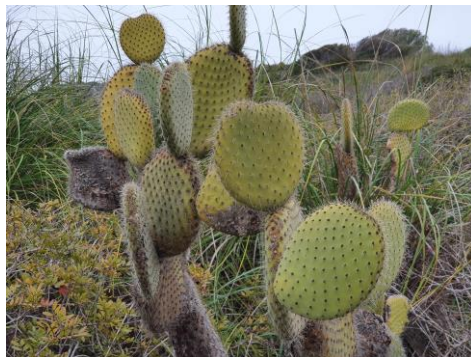
Fig. 6. Opuntia leucotricha DC.

Espècie arribada com a contaminant amb les llavors de plantes emprades per estabilitzar els talussos del desviament de Ferreries. Inicialment (2014) es van detectar dos nuclis, aquest i un altre situat a la rotonda de cala Galdana (32SEE8526), solament aquest ha persistit, tot i que ocupa un espai reduït (< 100 m 2 ). A les Balears, creix a Eivissa, Formentera i Mallorca, en aquesta illa sembla estar en expansió (Sáez et al. , 2011). A les altres illes sembla ser un tàxon autòcton, però a Menorca, la seva aparició sobtada, en una situació tan particular, el fet que no mostri una progressió fora d'aquells ambients de nova creació i que no es conegui de cap altra localitat de l'illa, tot açò, de moment, suggereix que és d'introducció recent.