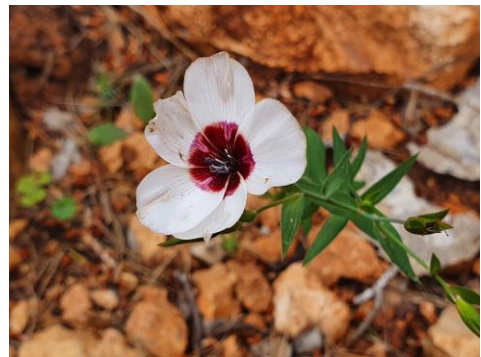
Fig. 4. Linum grandiflorum L.

ornamental, apreciada per les flors grosses. Habitualment es cultiven les formes amb els pètals vermells, però també existeixen cultivars i seleccions amb les flors bicolors. Les plantes de Cala Mitjana eren d'aquest darrer grup: pètals blancs amb la base de color vermell. Probablement hagin arribat per via antròpica, de forma involuntària. Com en altres espècies del gènere (Western, 2012), les llavors produeixen un mucíl·lag que actua com adherent. A Menorca, s'ha cultivat com a ornamental (Rodríguez, 1874), però avui no és habitual amb aquest ús. Es pot especular que aquestes plantes tinguin l'origen en antics cultius en els jardins de llocs, on habitualment hi havia més diversitat d'ornamentals en conreu. Fins ara coneguda de Mallorca (Martínez Labarga i Muñoz Garmendia, 2015), encara més recentment, s'ha localitzat també a Eivissa (Llorenç Sáez, com. pers.).