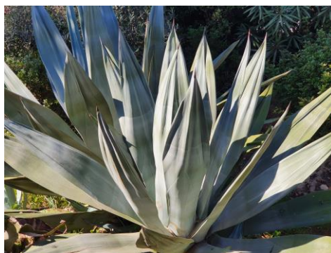
Fig. 1. Agave weberi J.F. Cels ex J. Poiss.

Espècie que pertany al grup d' A. sisalana (Gentry, 1982), com aquella espècie, les fulles no tenen espines en els marges. Precisament, apreciada en jardineria per aquesta característica i pel color glauc intens de les fulles. En regions properes, es coneix naturalitzat de València (Guillot Ortiz et al. , 2009).