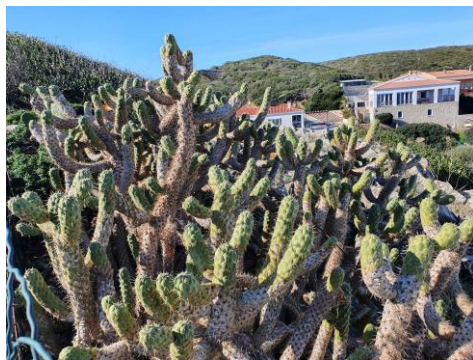
Fig. 2. Austrocylindropuntia cylindrica (Lam.) Backeb.

Segona espècie del gènere que es coneix com a naturalitzada a Menorca. A diferència d' A. subulata (Muehlenpf.) Backeb., de cultiu habitual i naturalitzada (Fraga et al., 2004), aquest altre tàxon pràcticament no es coneix en cultiu. Es poden diferenciar per l'hàbit de creixement, més baix i estès a A. cylindrica , més alt i amb una soca principal més definida a A. subulata . També hi ha un diferència en la presència de fulles a la part jove de les tiges més freqüents i persistents a A. subulata , sovint no presents i poc persistents a A. cylindrica . Es coneix com a naturalitzada del llevant i sud de la Península Ibèrica (Guillot Ortiz et al., 2014; Sánchez Gullón, 2013) i de les Illes Canàries (Sanz Elorza et al., 2004).