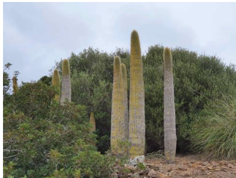
Fig. 3. Cephalocereus polylophus (DC.) Britton & Rose

així com la morfologia d'aquestes darreres (Ciciarelli i Rolleri, 2008). Les plantes del gènere són de cultiu habitual en jardineria, però la gran majoria corresponen a híbrids que inclouen diferents espècies en el seu origen (Khoshoo i Mukherjee, 1970). És la tercera espècie del gènere naturalitzada a Menorca, fins ara s'havien citat C. flaccida Salisb. (Fraga et al., 2004) i C. glauca L. (Fraga et al., 2015).