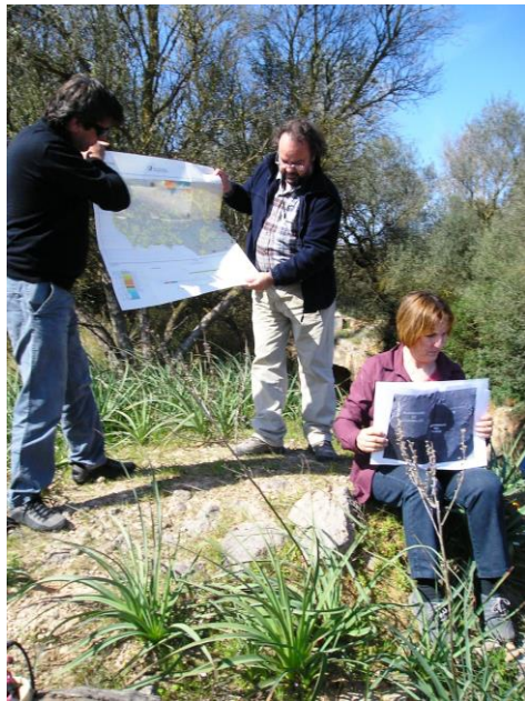
Fig. 5. Quart Geo-beranar, el 24-03-2012. Pedreres subterrànies de son Grau i des Monjos.

L'any 2015, va ser un any especial, va depositar la seva tesi a la UIB i la va defensar el febrer del 2016. La tesi, titulada “El registre estratigràfic del Messinià terminal i del Pliocè a l'illa de Mallorca. Relacions amb la crisi de salinitat de la Mediterrània”, estableix