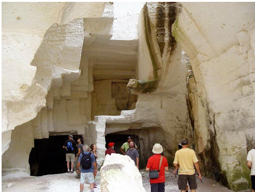
Fig. 4. Primer Geo-berenar, el 03-09-2011. Pedreres de sa Mola de Felanitx.

va ser a l'aflorament del Miocè de sa cova Llarga a Petra, el 2 de desembre de 2017. El 2014 va presentar la seva memòria d'investigació al departament de Ciències de la Terra de la UIB, titulada La sedimentació tipus Lago Mare (Messinià terminal) i la transgressió del Pliocè a la conca de Campos (Mallorca, Illes Balears). Relació amb la crisi de salinitat a la Mediterrània , encaminant la publicació al Bolletí i altres revistes d'articles relacionats amb el Miocè i el Pliocè, abans i després de la defensa de la seva tesi, sense deixar les Jornades d'Estudis Locals i altres congressos.