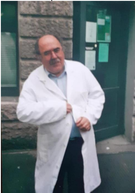
Fig. 4. A la Universitat de Tübingen any 2003.

Encara que sempre va pensar que la seva decisió de treballar per a la indústria va ser la correcta, la seva passió per la investigació el va portar a optar a la càtedra de micropaleontologia de la Universitat de Tübingen (Alemanya). Pel que sembla, la seva conferència i les entrevistes van ser molt bones, de manera que va quedar primer a la llista de candidats. Les negociacions amb el Ministeri a Stuttgart sobre salari i equipament van anar força bé i es va incorporar a la càtedra el 1977. A l’Institut Geològic va ser ben rebut pels seus companys. Al principi era una mica inexpert i massa poc familiaritzat amb els costums acadèmics d’una antiga universitat alemanya. Preferia les pràctiques en què tenia contacte directe amb els alumnes, especialment les sortides de camp. En els primers anys es van subvencionar amb força generositat perquè no ocasionessin costos excessius als alumnes. Quan van escassejar els diners per subvencionar les