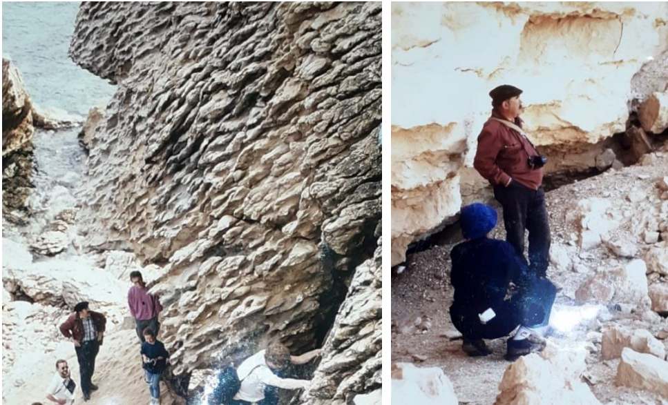
Figs. 7 i 8. Campanyes de camp amb alumnes de la Universitat de Tübingen.