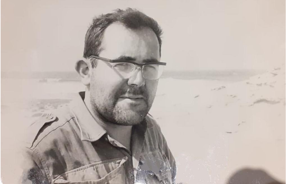
Fig. 3. Campanya de camp al Marroc any 1967.