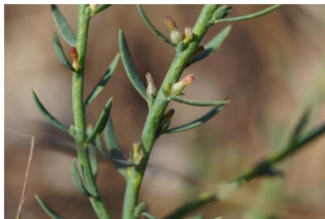
Fig. 6. Thymelaea passerina (L.) Coss. & Germ., detall de les tiges floríferes.

útil per a la seva identificació. Com a indiquen tots aquests autors per altres regions, és molt probable que també a Menorca una part important de les citacions de S. media corresponguin a S. ruderalis . Tanmateix, tant la presència de S. media com de S. neglecta Weihe, queden confirmades a l'illa després d'haver consultat el material d'herbari.