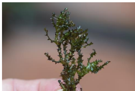
Fig. 5. Najas marina subsp. armata Horn

Hydrocharytaceae. En aquesta localitat l'espècie es distribueix per gran part de la superfície de la llacuna, formant motes de fins 1 metre de diàmetre. L'hàbitat és el característic d'aquesta subespècie (Talavera i Gallego, 2010). Sovint aquesta llacuna no s'eixuga durant l'estiu, aquest fet, les aigües tèrboles i el sòl fangós profund que dificulta l'exploració, podrien explicar que fins ara no s'hi hagués detectat. La planta de Menorca és densament espinosa, amb les fulles curtes, relativament amples i amb les dents molt pronunciades (Fig. 5).