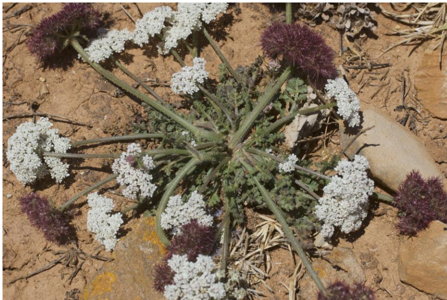
Fig. 2. Daucus carota subsp. drepanensis (Tod. ex Lojac.)

31SEE9713, 50 m, pradells de teròfits, poc densos, en sòl calcari argilós, 7-V-2020, P. Fraga (P. Fraga, herb. pers.); Son Bou, Alaior, replans de penyes amb pradells de teròfits en sòl calcari arenós, 14-V-2020, P. Fraga (P. Fraga, herb. pers.).