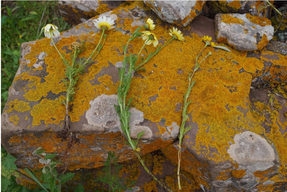
Fig. 3. Individus recol·lectats in situ de Glebionis coronaria (L.) Cass. ex Spach. (esquerra), G. x merinoana (Pau) P. Fraga & C. Mascaró (centre), G. segetum (L.) Fourr. (dreta).