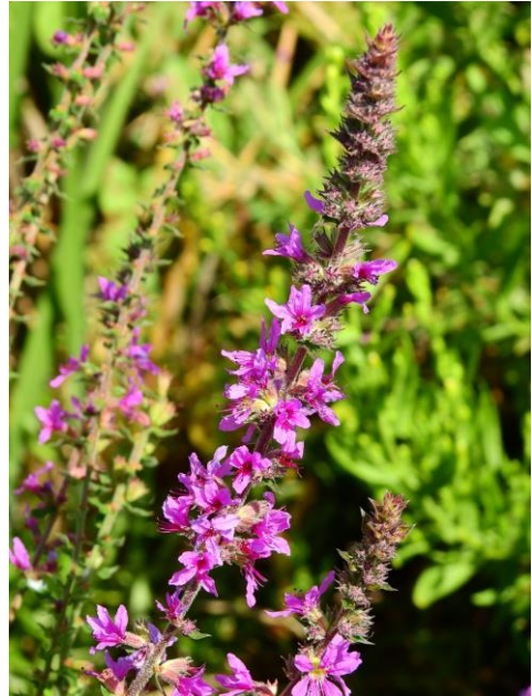
Fig. 4. Lythrum salicaria L., detall de la inflorescència.

Hi havia indicis de la presència d'aquesta espècie a Menorca (Andrés Bermejo, com. pers.), però fins aquesta citació no s'ha pogut confirmar. A les Balears era coneguda de Mallorca (Bonafè, 1979).