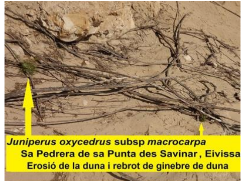
Juniperus oxycedrus subsp macrocarpa Sa Pedrera de sa Punta des Savinar, Eivissa Erosió de la duna i rebrot de ginebre de duna

4. Competència amb altres espècies vegetals per l'espai, de Salvia rosmarinus , Pistacia lentiscus , Pinus halepensis , Erica multiflora , Helichrysum stoechas i Juniperus turbinata .