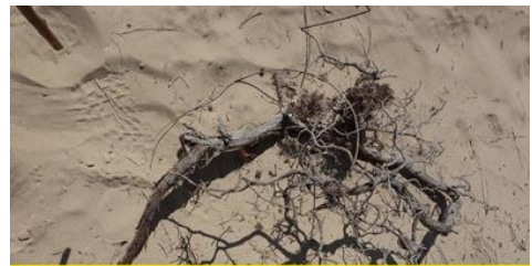
Juniperus oxycedrus subsp macrocarpa Sa Pedrera de sa Punta des Savinar, Eivissa Planta morta per l'erosió

Figs 4 i 5. Situació de diverses arrels de J. oxycedrus subsp. macrocarpa . L'erosió ha afectat al sistema radicular del ginebre de duna. Com que les arrels són prou llargues, no s'ha pogut determinar exactament el nombre d'individus. Es parla sobre el nombre de peus en aquest article.