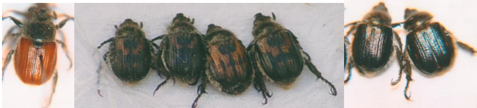
Fig. 3. Distintas formas cromáticas de Anisoplia remota Reitter, 1889. Fig. 3. Different chromatic forms of Anisoplia remota Reitter, 1889.

Como otras especies del género, Anisoplia remota tiene varias formas cromáticas, y en los individuos menorquines, aparte del color corporal negro, en los élitros presenta varios tipos de coloración, desde la forma típica pardo amarillenta (alrededor del 65% de los ejemplares capturados), a los élitros negros, de intensidad a veces algo reducida, probablemente en ejemplares juveniles, (el 10 % del total), que constituye la ab. funerea Muls., y la también negra con una gran mancha arqueada amarilla, común, en