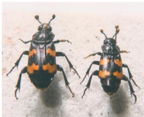
Fig. 1. Nicrophorus interruptus Stephens, 1830.

Aunque la especie cuenta con numerosas variedades cromáticas (Portevin, 1926; Báguena, 1965), los ejemplares menorquines que he visto (Compte), son re-