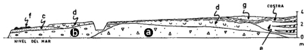
Fig. 2. Tall de Punta Roja segons de Butzer i Cuerda (1961). Escala vertical 3x. a- Bretxa. b- Conglomerat sub-arrodonit. c- Eolianita rosada. d- Platja i rere platja del MIS 5e amb una crosta a la part superior. e- Arenes llimoses amb lleties de graves. f- Conglomerats de platja del MIS 5a. g- Arenes sub-recents.

Els autors anteriors consideren el nivell a i el nivell b com a diferents. Vicens (2015) considera que no es veu tan clar la distinció entre els dos nivells i que podria