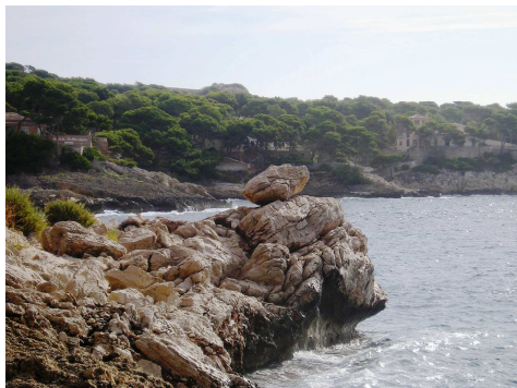
Fig. 3. Bloc a cala Gat a uns +6 m snm. No s'han observat evidències de que aquest bloc fos llançat per l'onatge produït per un tsunami.

-Es poden observar estrats al bloc que segueixen gairebé el mateix cabussament que els estrats de la roca que hi ha per davall. La diferència d'inclinació són pocs graus.