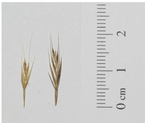
Fig. 5. Detalls de les espiguetes de Vulpia geniculata subsp. geniculata (L.) Link (esquerra) i V. geniculata subsp. breviglumis (Trabut) Murbeck (dreta).

V. geniculata és una de les gramínies anuals més freqüents i abundants a Menorca. Especialment a les terres silícies del nord on forma extenses poblacions i sovint és dominant. Al mateix temps, mostra una elevada variabilitat morfològica que fins ara no s'ha estudiat a fons. La observació de Landino sobre aquest testimoni és encertada. Maire (1955) indica el nombre de flors per espigueta com un dels caràcters per identificar les subespècies de V. geniculata que creixen a Àfrica del Nord. L'observació detallada d'aquest testimoni, la seva comparació amb els altres de la mateixa col·lecció i d'altres mostres de l'illa ha revelat altres diferències: inflorescència compacta amb ramificacions curtes, glumes més curtes que l'espigueta, aresta de les lemnes més curta que el cos (Fig. 5), aquests caràcters coincideixen amb la subsp. breviglumis , fins ara només coneguda d'Àfrica del Nord (Maire, 1955).