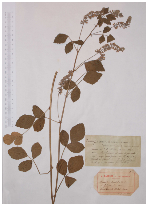
Fig. 2. Testimoni de Cullen americanum (L.) Rydb.

Rodríguez (1904) recull diferents localitats de C. taraxacifolia Thuill, però posteriorment s'ha comprovat que totes elles corresponen a C. vesicaria L. per la confusió que ha hagut entre aquests dos tàxons. La única localitat de C. vesicaria que indica aquest autor és de Porta (1887). A l'Herbari Landino hi ha tres testimonis identificats com C. taraxacifolia Thuill., tanmateix la revisió del material ha mostrat que dos d'ells tenen els caràcters típics de C. vesicaria L. subsp. vesicaria : plantes