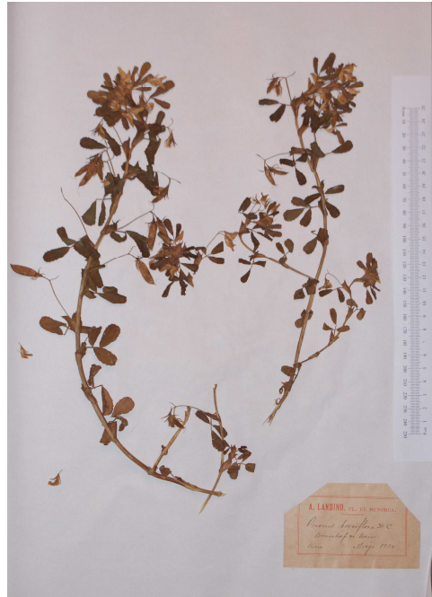
Fig. 3. Testimoni d' Ononis viscosa subsp. viscosa L.

L'examinació del testimoni identificat com O. breviflora va mostrar que aquest presentava caràcters diferents a les altres mostres d'aquest tàxon, relativament