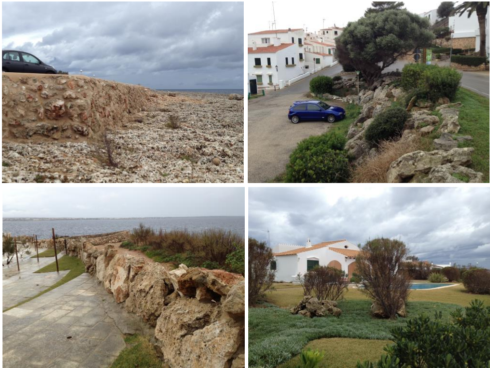
Fig. 4. Utilització de blocs associades per a reblits de carreteres (superior esquerre), estabilització de talussos (superior dreta), construcció de parets (inferior esquerra) o amb finalitats ornamentals (inferior dreta).

Aquest treball es configura com un document de partida sobre els processos erosius als penya-segats de Menorca que presenten activitat, amb base a la realització d'enquestes, i la ubicació de les