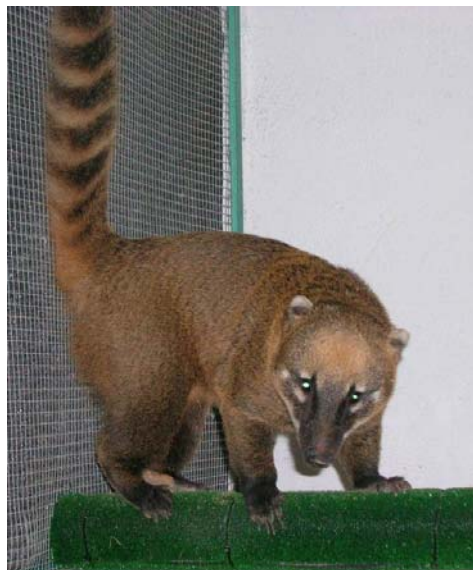
Fig. 1. Exempler de coatí, Nasua nasua L.

El Coatí, Nasua nasua (L. 1766), conegut també com a pizote o pisote , és un carnívor diürn centre i sud-americà, de la família Procyonidae, de talla mitja (de 76 a 104 cm de longitud i pes mig de 4,5 kg.) color roig terrós, amb conspicües bandes