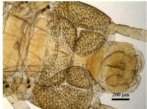
Fig. 9. Preterguito y metaterguito del último segmento pedífero en Himantarium gabrielis .

MATERIAL: Puig de Vilarrassa (Calvià) U.T.M 461233 / 4378344-360: 1 juv., 10-V-2008, M. Vadell leg., (CMV, reg. núm. 100508-4).