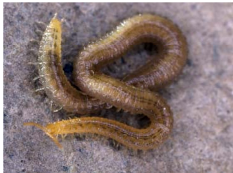
Fig. 11. Habitus de Henia vesuviana .