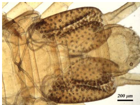
Fig. 6. Preterguito y metaterguito del último segmento pedífero en Stigmatogaster arcisherculus .

Fig. 5. Detail of virguliform fossae and paratergital fossa in Stigmatogaster arcisherculus.