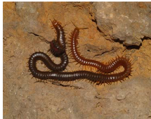
Fig. 7. Habitus de Himantarium gabrielis . Fig. 7. Habitus of Himantarium gabrielis .

Los ejemplares capturados tienen un cuerpo robusto y muy largo, atenuado ligeramente hacia delante. Presentan una coloración parda pajiza, con una línea mediana de color rojizo a todo lo largo de los esternitos (Fig. 7). Esta coloración corresponde con la sustancia que segregan las glándulas exocrinas que poseen en su parte ventral y que desembocan en el grupo de poros de los esternitos. El líquido segregado tiene un olor que recuerda a las almendras amargas y produce en la piel humana cierta descamación al contacto con ella (obs. pers. M. Vadell). Los ejemplares hembras estudiados, presentan unas longitudes comprendidas entre los 61.6 mm con 143 segmentos pedíferos en el 041106-2 y 150 mm con 149 segmentos pedíferos en el ejemplar 271208-1.