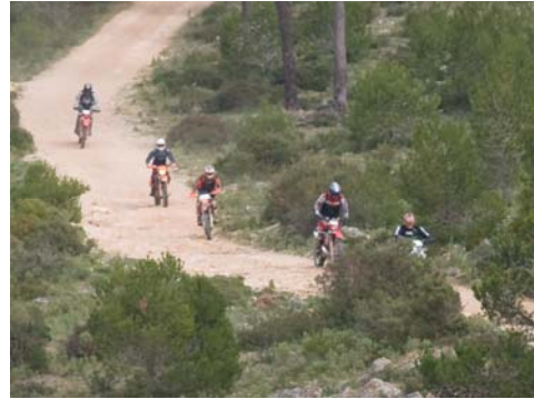
Fig. 2. Impacto del motocross por la zona de na Burguesa.

Entre los años 2006 a 2009, aprovechando un estudio sistemático de localización, catalogación, topografía y estudio integral de cavidades de la Serra de na Burguesa, se recolectaron muestras de la fauna quilopó-