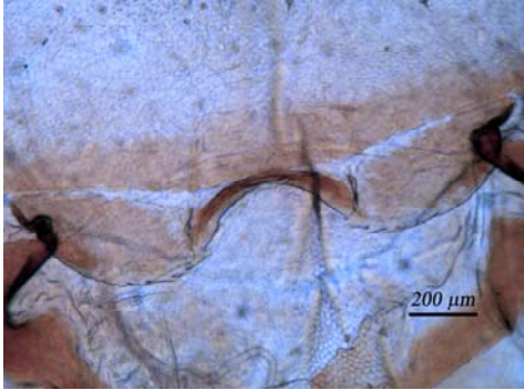
Fig. 8. Labro de Himantarium gabrielis . Fig. 8. Labrum of Himantarium gabrielis .

Los machos presentan unas longitudes que varían entre los 185 mm en el ejemplar 111008-2 con 143 segmentos pedíferos, 155 mm y 145 segmentos pedíferos en el espécimen 271208-2 y 132 mm con 141 segmentos pedíferos en el ejemplar 271208-3.