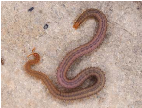
Fig. 10. Habitus de Dignathodon microcephalus . Fig. 10. Habitus of Dignathodon microcephalus .

Citado por primera vez en las islas Baleares en Mallorca por Verhoeff (1924) en Palma y Sóller, posteriormente se cita en Portals Vells (Calvià), Torrente de sa Calobra (Escorca) (Negrea y Matic, 1973) y