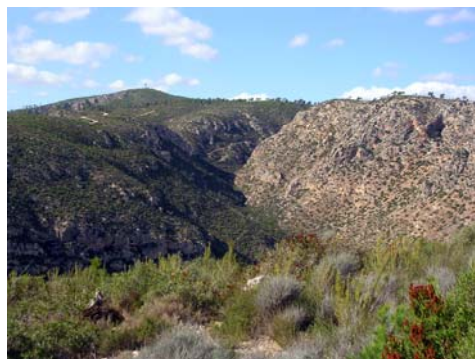
Fig. 1. Paisaje de la zona de na Burguesa. Fig. 1. Landscape of na Burguesa.

En la actualidad la vegetación está constituida, mayoritariamente, de matorral bajo (Fig. 1) y podemos encontrar en mayor