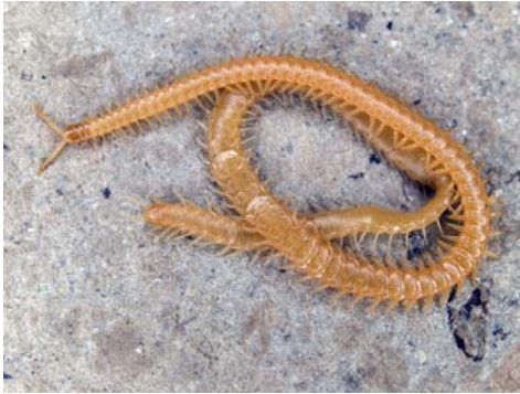
Fig. 3. Habitus de Stigmatogaster arcisherculus . Fig. 3. Habitus of Stigmatogaster arcisherculus .

138: 1 ♂, 12-XII-2009, C. Andújar leg., (CMV reg. núm. 121209-1); Cova de les Rodes (Pollença) U.T.M 504374 / 4419053-35: 1 ♀, 12-XII-2009, C. Andújar leg., (CMV reg. núm. 121209-2).