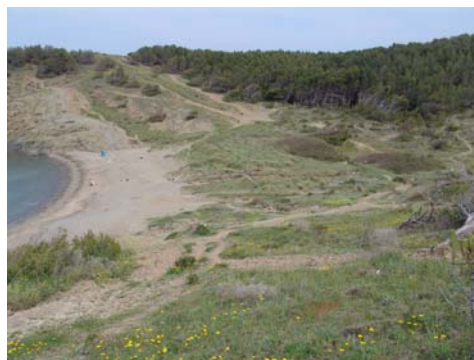
Fig. 4. Estadi de conservació del sector dunar davanter de cala Borró.

Associat al canal de runnel de la zona dunar davantera, es troba un sector de sorres semiestabilitzades, marcat per l'existència d'un camí que fragmenta i compacta la zona de contacte. El sistema assoleix una extensió al voltant de les 17 ha