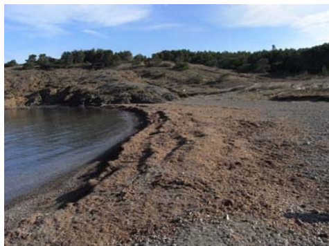
Fig. 3. Acumulacions de bermes de Posidonia oceanica sobre la zona de batuda de la platja de cala Borró.

Fig. 3. Berms acumulacions of Posidonia oceanica over swash zone of Cala Borró beach.