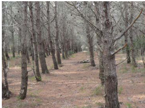
Fig. 5. Alineacions de la sembra de pi ( Pinus halepensis ) a les zones de morfologies estabilitzades.

Fig. 5. Alignments showing pine ( Pinus halepensis ) in areas of stable morphologies.