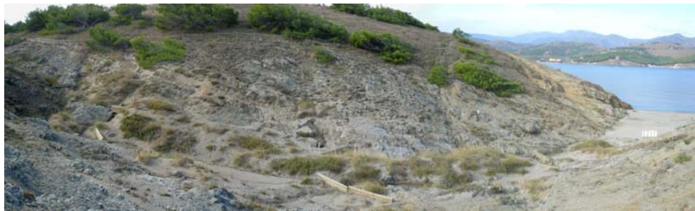
Fig. 6. Desenvolupament de formes dunars remuntants associades als canals torrencials de Borró Petit.

Fig. 6. Climbing dune forms associated with torrential channels of Borró Petit.