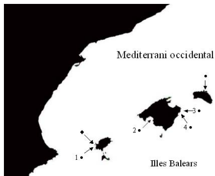
Fig. 1. Localització de les captures (●) i els albiraments (◆) de Fistularia commersonii . Els nombres identifiquen els individus de la Taula 1.

El primer individu (exemplar núm. 1 de la Taula 1) es va capturar durant un campionat de pesca submarina a Cala d'Hort (Eivissa) el 28 d'octubre de 2007. La segona captura (exemplar 2 de la Taula