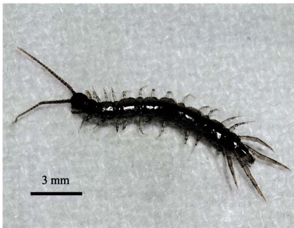
Fig. 2. Vista dorsal de un ejemplar hembra de Lithobius hispanicus . Fig. 2. Dorsal view of a female of Lithobius hispanicus .