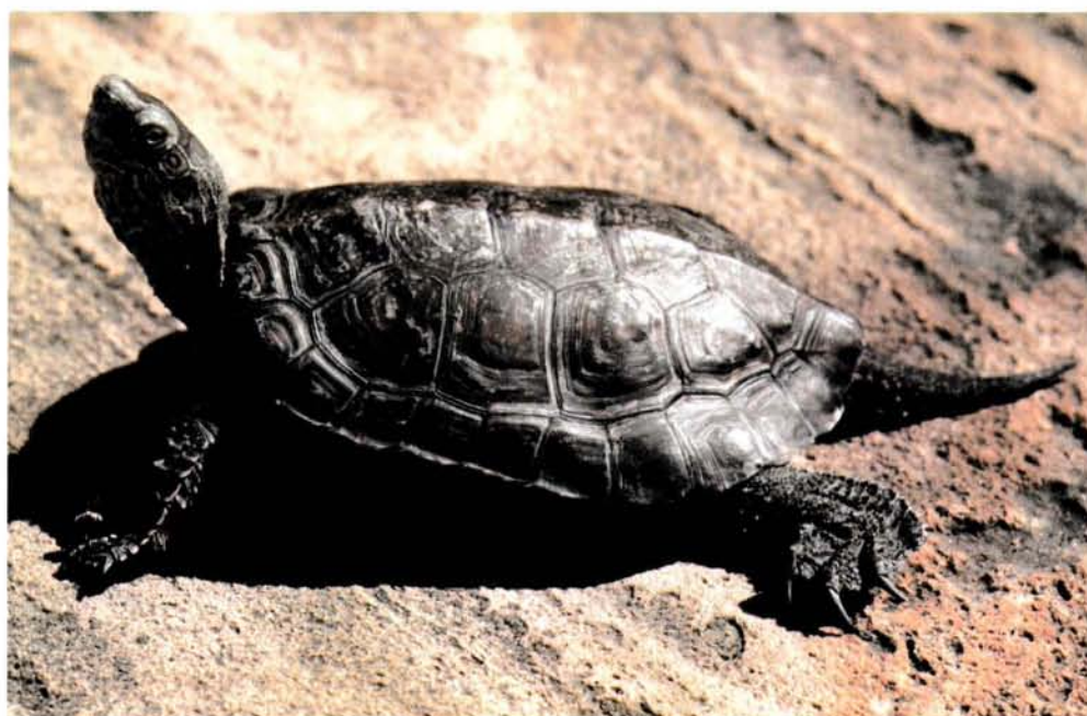
Fig. 3. Mauremys leprosa (Schweigger, 1812).

dos juvenils i s'observaren al menys tres juvenils més, el que fa pensar que existeix un petit nucli reproductor a la zona.