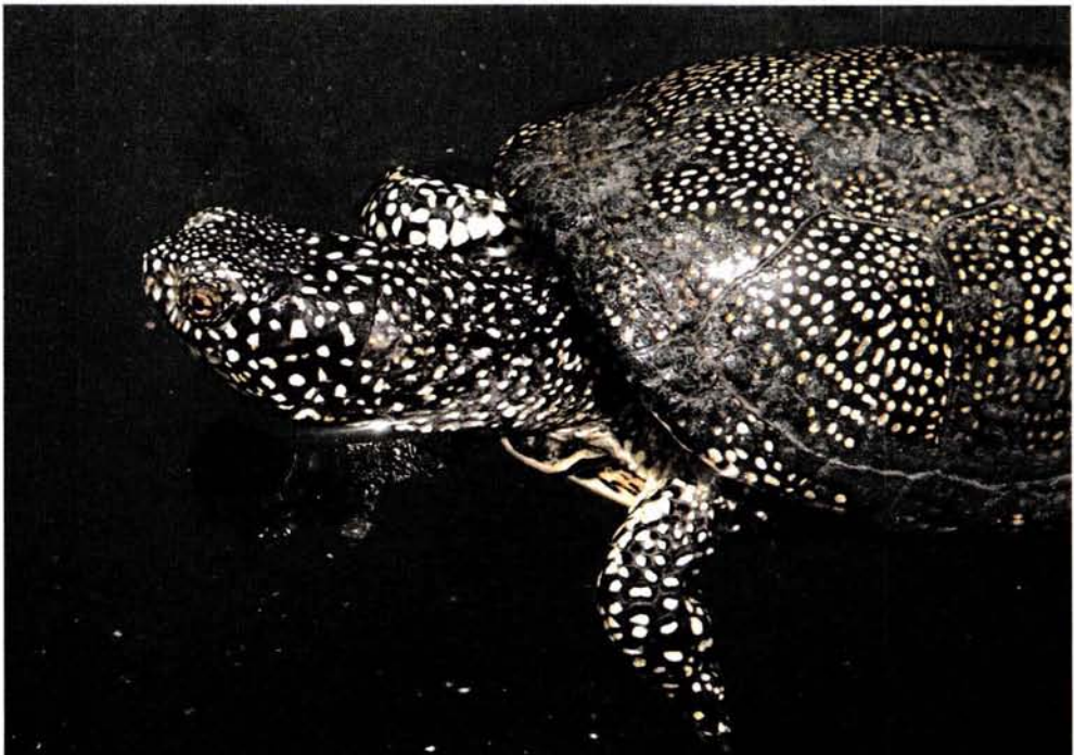
Fig. 1. Emys orbicularis (Linnaeus, 1758).

Durant les dècades dels 80 i 90 arriben a Espanya milions d'exemplars de Trachemys scripta , una tortuga d'origen nord-americà. El primer registre que es té de la importació d'aquesta espècie data de l'any 1983 quan arribaren a Espanya procedents dels Estats Units 185.000 exemplars (Barquero, 2001; Pleguezuelos, 2002). Durant el bienni 1994-