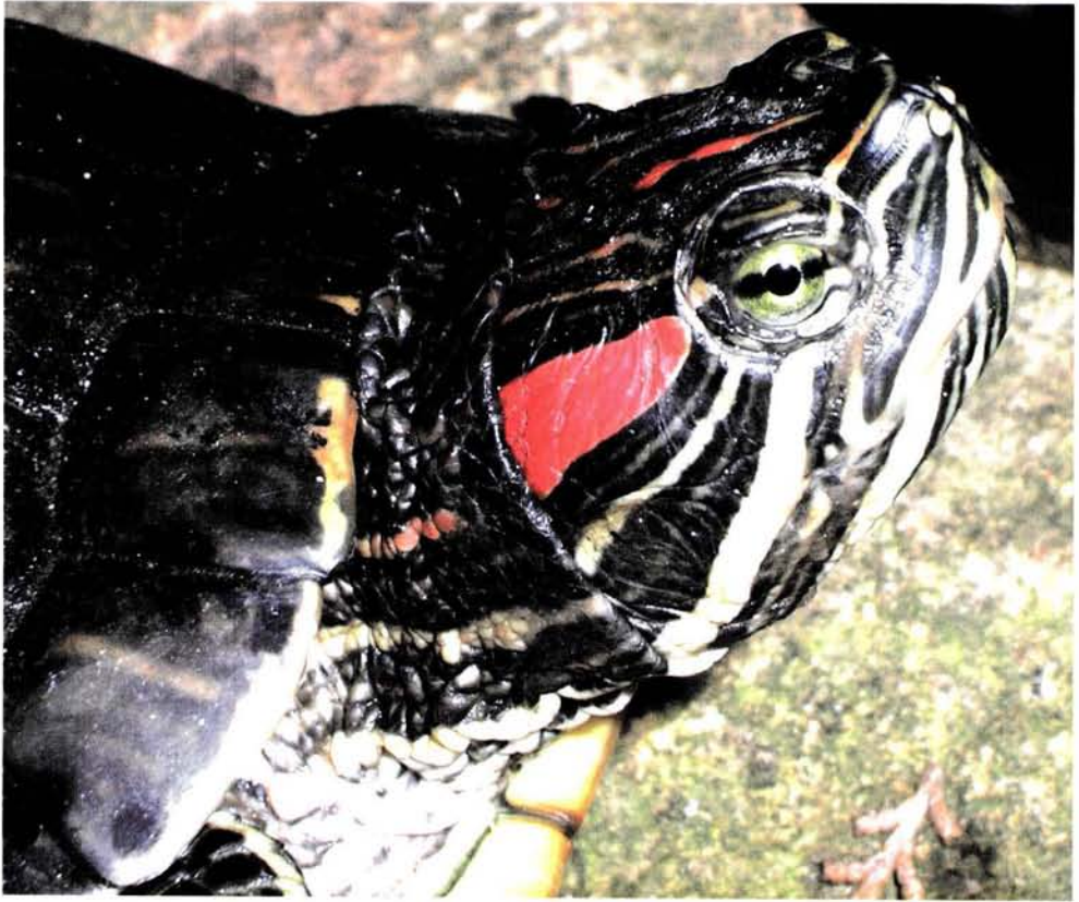
Fig. 4. Trachemys scripta elegans (Weid-Neuwied, 1839).