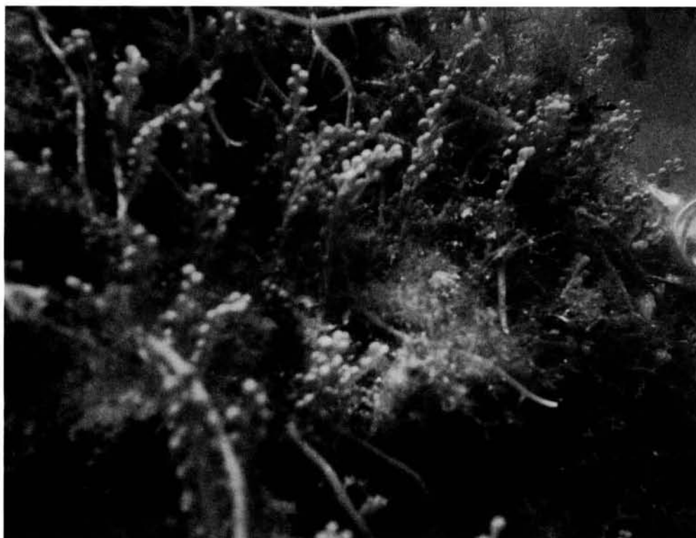
Fig. 1. Caulerpa racemosa var. cylindracea a sobre d'una comunitat de macroalgues fotòfiles a la localitat de S'Estància

Fig. 1. Caulerpa racemosa var. cylindracea on a photophyla macroalgae community at S'Estància site.