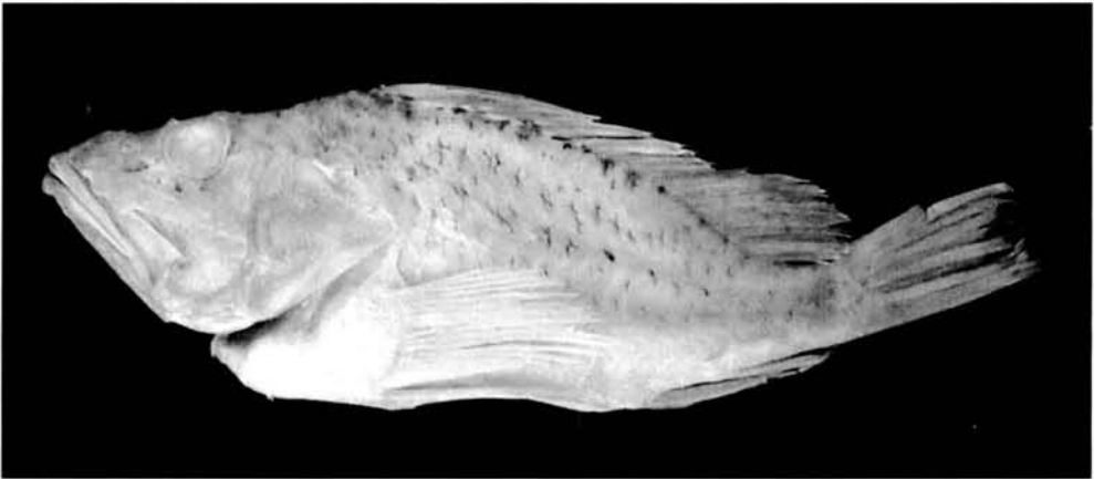
Fig. 2. Pontinus kuhlii . Ejemplar de aguas de Menorca. Visión lateral. Fig. 2. Pontinus kuhlii . Specimen from Minorca coast. Lateral aspect.

La ictiofauna balear ha sufrido unos cambios significativos en su composición, indicando un proceso de meridionalización reflejado en la aparición de especies termófilas no citadas con anterioridad y la desaparición o decreci-