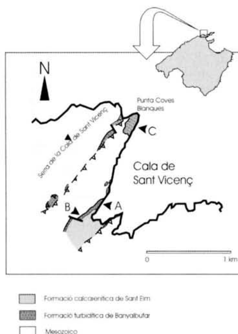
Fig. 1. Situació de l'àrea d'estudi i dels afloraments miocens, i localització (A,B,C) de les series estratigràfiques analitzades.

Fig. 1. Situation of the Miocene Deposits in Cala Sant Vicenç. A, B and C are the location of the stratigraphic columns.