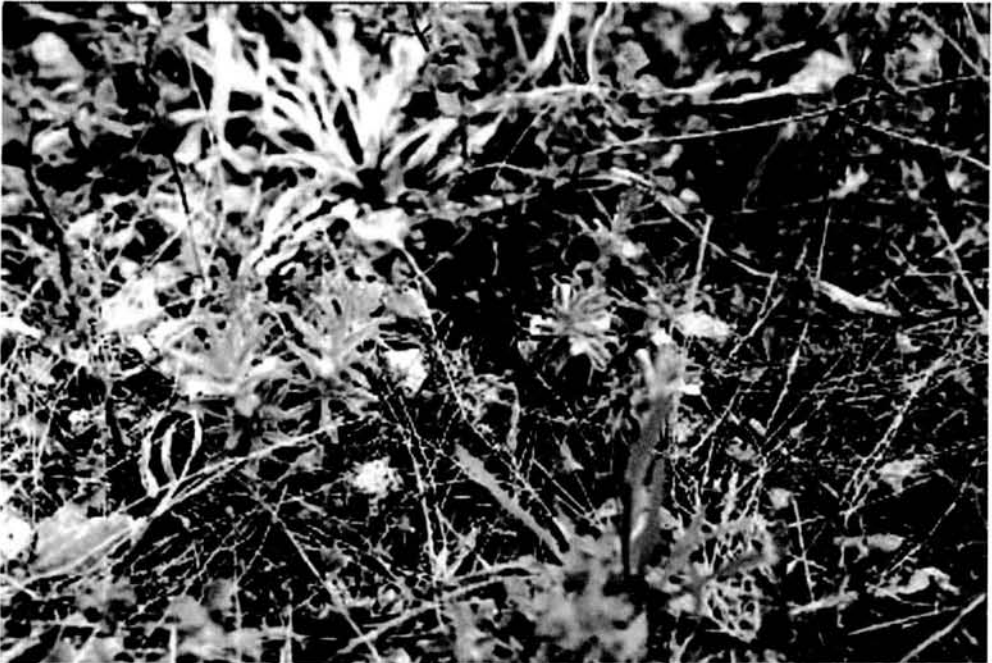
Fig. 1. Ajuga iva subsp. iva (esquerra) i A. iva subsp. pseudoiva (dreta) creixent juntes.