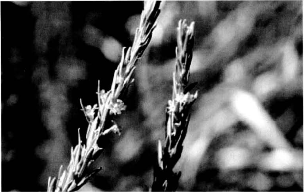
Fig. 3. Lythrum hyssopifolia (esquerra) i L. thymifolia (dreta).