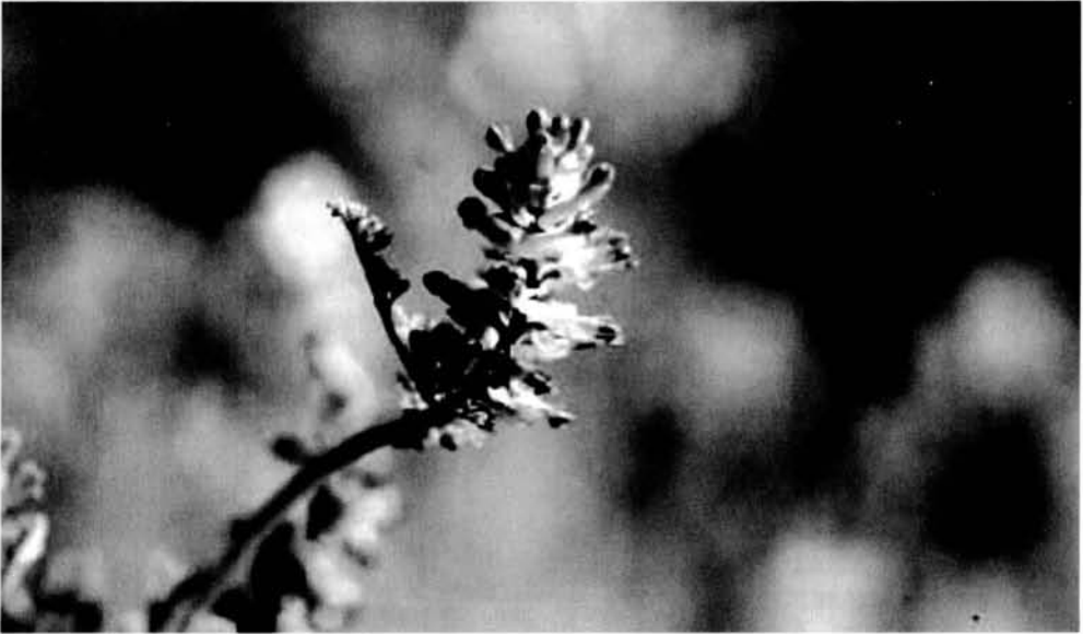
Fig. 2. Fumaria densiflora DC.

Fins ara l'única referència que es tenia de la presència d'aquesta planta a Menorca era de