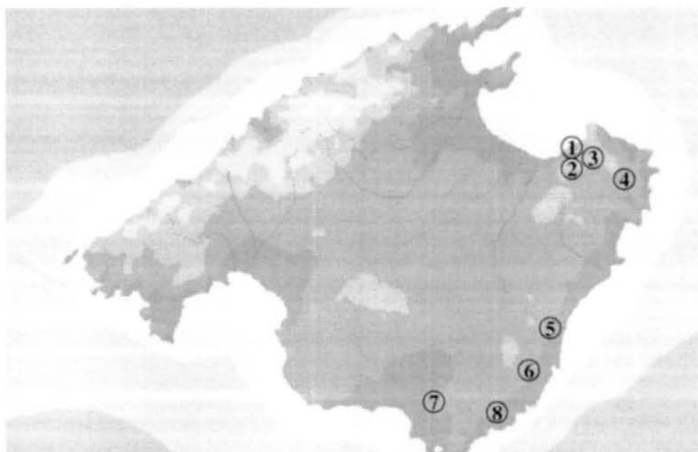
Fig. 1. Localización de los suelos.