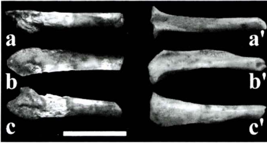
Fig. 2. Comparació de l'espècimen MNIB 68750 (a: norma caudal; b: norma lateral; c: norma medial), ja preparat (tot i que encara té una petita pedra concrecionada a la part proximal, a l'esquerra de la fotografia, ben visible en norma caudal i medial), amb una tibia dreta d' Eliomys morpheus , MNIB 68751, provinent de la cova Estreta (Pollença, Mallorca) (a': norma caudal; b': norma lateral; c': norma medial). Escala: 1 cm.

Fig. 2. Comparison of the prepared MNIB 68750 specimen (a: caudal view; b: lateral view; c: medial view), (with remains of a little stone in the proximal part, at the left of the photograph, visible in caudal and medial view), and a left tibia of Eliomys morpheus , MNIB 68751, from Cova Estreta (Pollença, Mallorca) (a': caudal view; b': lateral view; c': media view). Scale: 1 cm.