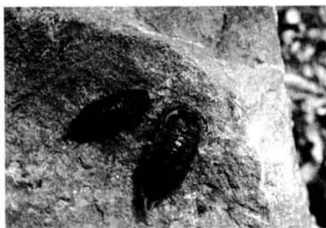
Fig. 2. Porcellio ornatus Milne Edwards, 1840.

Observaciones. También ha sido recolectado gracias a trampas de caída Porcellio sp. de pequeño tamaño en las islas Isabel II y Congreso. Podría tratarse de ejemplares juveniles de esta especie.