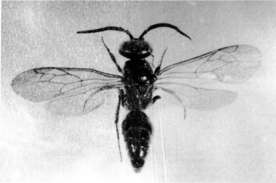
Fig. 1. Smicromyrmilla sp. (macho) del Camerún. Se diferencia de S. miranda n. sp por la celda radial alargada.

Fig. 1. Smicromyrmilla sp. (male) from Camerun. It is differentiated from S. miranda n. sp. by its elongated radial cell.