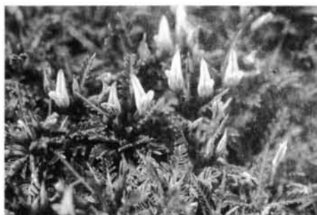
Fig. 1b. Detall de les flors d'aquesta papilionàcia.

Fig. 1a. Astragalus balearicus , an endemic, small-sized pillow-like shrub.