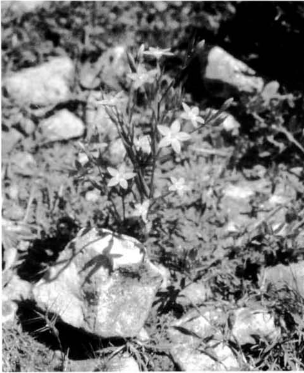
Fig. 2. Centaurium bianoris es tracte d'una espècie endèmica d'origen híbrid entre C. maritimum i C. pulchellum .

Fig. 2. Centarium bianoris, an endemic species originated by crossing of C. maritimum and C. pulchellum.