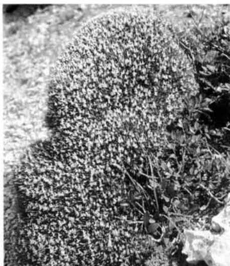
Fig. 1a. L'eixorba-rates negra ( Astragalus balearicus ) és un petit arbust endèmic amb forma de coixinet.

Fig. 1a. Astragalus balearicus , an endemic, small-sized pillow-like shrub.