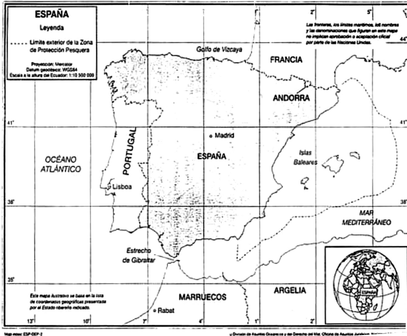
Font: J. M. LACLETA MUÑOZ, Las fronteras de España en el mar , Real Instituto Elcano, DT n° 34/2004.

zona de protecció pesquera a la Mediterrània que s'estenia fins a les 37 milles nàutiques comptades des del límit exterior del mar territorial. En aquesta zona, Espanya “tenia drets sobirans a efectes de la conservació dels recursos marins vius, així com per a la gestió i control de l'activitat pesquera”. A continuació es detalla l'extensió de la zona pesquera: