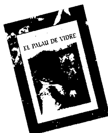
GABRIEL JANER MANILA EL PALAU DE VIDRE

és una producció d'EDICIONS LA FORADADA J. J. de Olañeta, Editor Apartat 296-07080 Palma de Mallorca