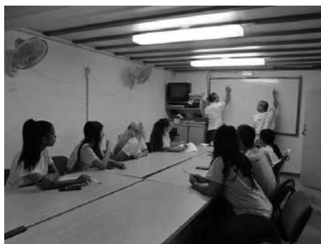
Imatge 1: Formació teòrica a l'aula

D'altra banda, a final de projecte, l'alumnat treballador ha rebut una formació de 15 hores de durada, en Inserció laboral i tècniques de recerca d'ocupació. S'acosta el moment d'enfrontar-se al mercat laboral, i mitjançant aquesta formació, els joves podran conèixer la situació del mercat de treball i les característiques de l'ocupació que busquen, les competències professionals i personals que els han de facilitar l'accés i les tècniques i recursos de les quals disposen per a aquest fi, de manera que podran elaborar un projecte professional personal que els permetrà la inserció laboral.