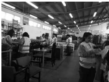
Imatge 2: Treball efectiu a la nau de donacions (botiga)