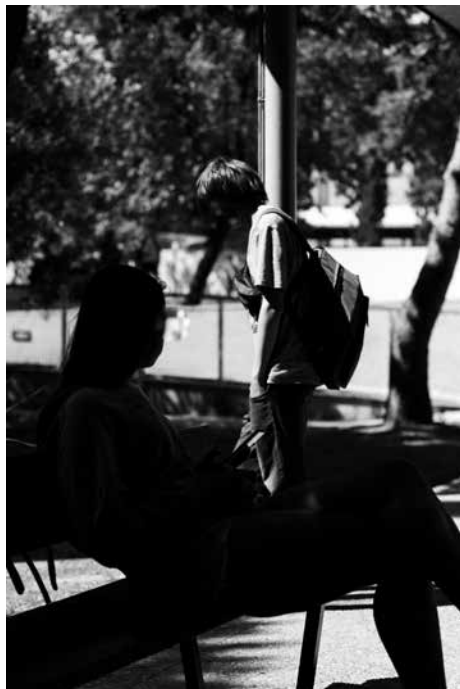
Font: elaboració pròpia.

provocat un deteriorament important de l'autoestima i s'enfronten al repte d'aprendre amb molta inseguretat. El format i contingut del projecte n'ha facilitat molt la implicació. Ha estat un grup que ha aportat moltíssim al procés, perquè l'experiència els ha fet reflexionar sobre les injustícies que han patit i sobre els factors de protecció que els han facilitat reconduir la trajectòria.