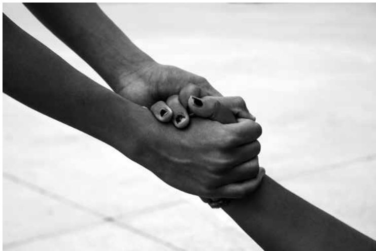
Font: elaboració pròpia.