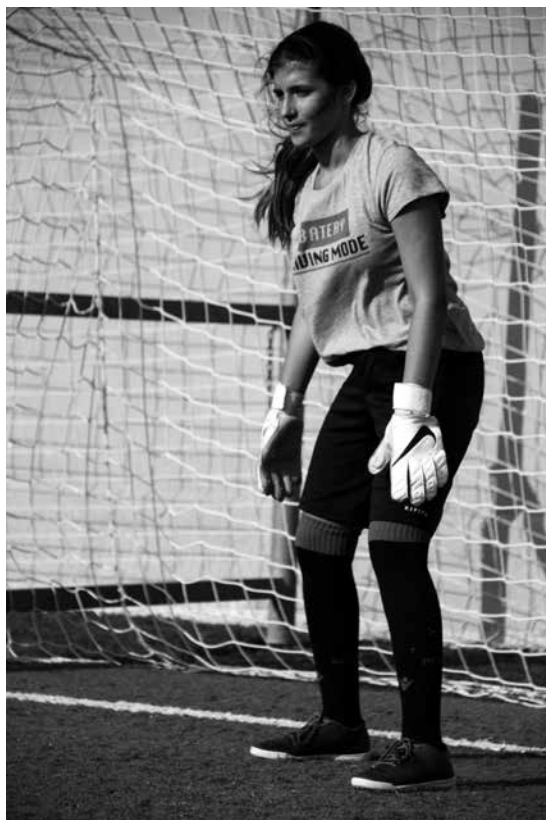
Font: elaboració pròpia.

Aquest grup actualment està format per unes vint-i-nou al·lotes, adolescents i joves. Catorze van participar en el projecte. Ha estat molt interessant treballar amb aquest grup