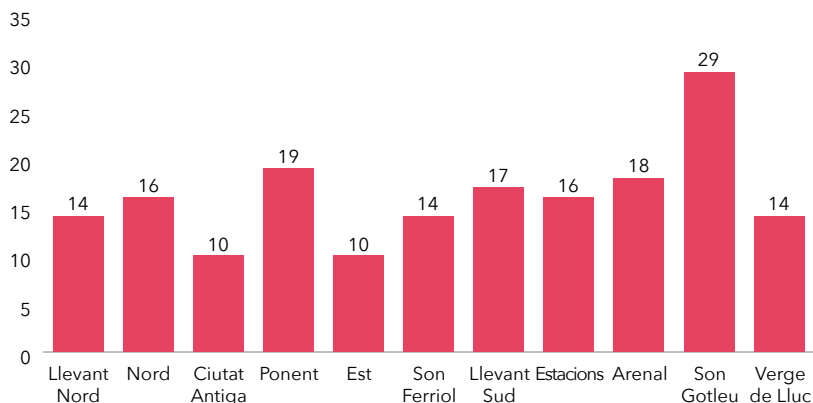
Gràfic 1. Comparativa de les inscripcions de les temporades 2014-15, 2015-16 i 2016-17.

neficiàries directes i més de 20 professionals a les barriades següents: Pere Garau, Ciutat Antiga, Nou Llevant, Es Rafal, Son Gotleu, Nord, Son Oliva, Son Ferriol, Arenal, Verge de Lluc i Ponent.